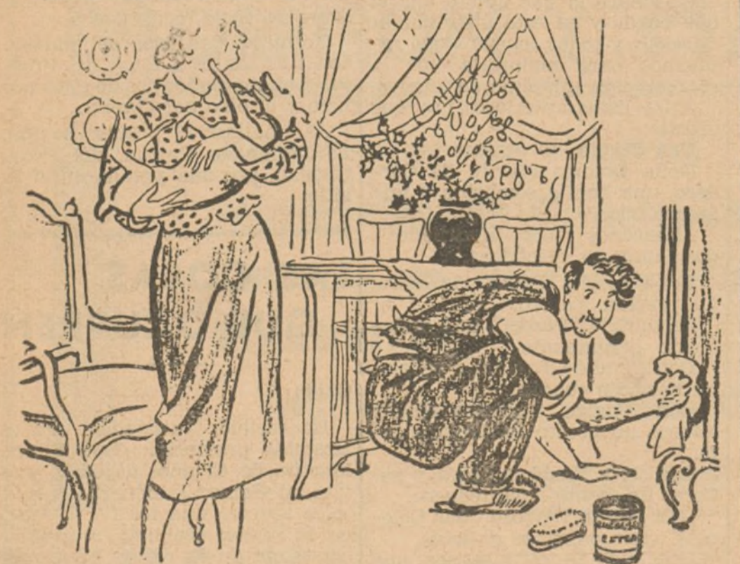
LA MUJER.--Cuando hayas sacado brillo a los muebles, ve a regar el jardín. No sé cómo puedes estar sin hacer nada todo el domingo. (De "Gringoire", de París.)