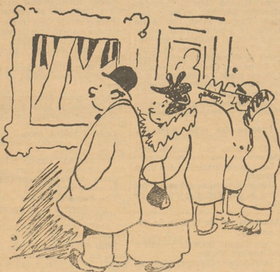
5.000 CUADROS EN LA EXPOSICION

--Si necesitas ocho minutos para cada cuadro, vendré a buscarte el mes que viene.