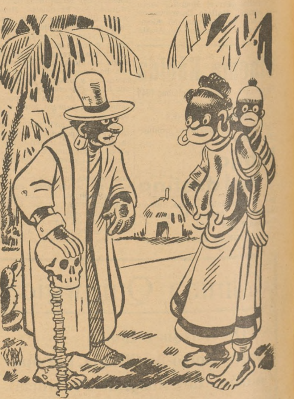
EN EL CONTINENTE NEGRO

--Siempre dije que mi nieto sería el báculo de mi vejez. (De "Settebello", de Roma).