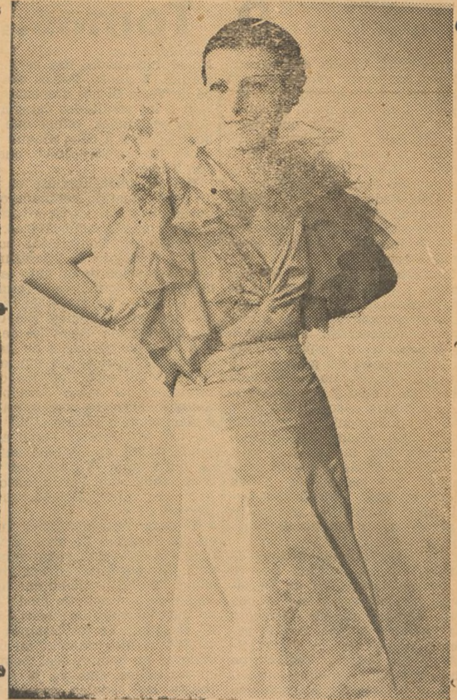
Precioso modelo en "glacé" verde Nilo. Los volantes de tul de los hombros son del mismo color

cino, cortando el tocino en tiras finas, atadas o pasadas por una aguja de mechar que se enlaza en la carne pasándola de modo que quede el tocino adentro y se pone al horno untado con manteca, aceite o grasa de cerdo. No conviene ponerlo directamente en la asadera, sino sobre un asador que se coloca dentro de la asadera.