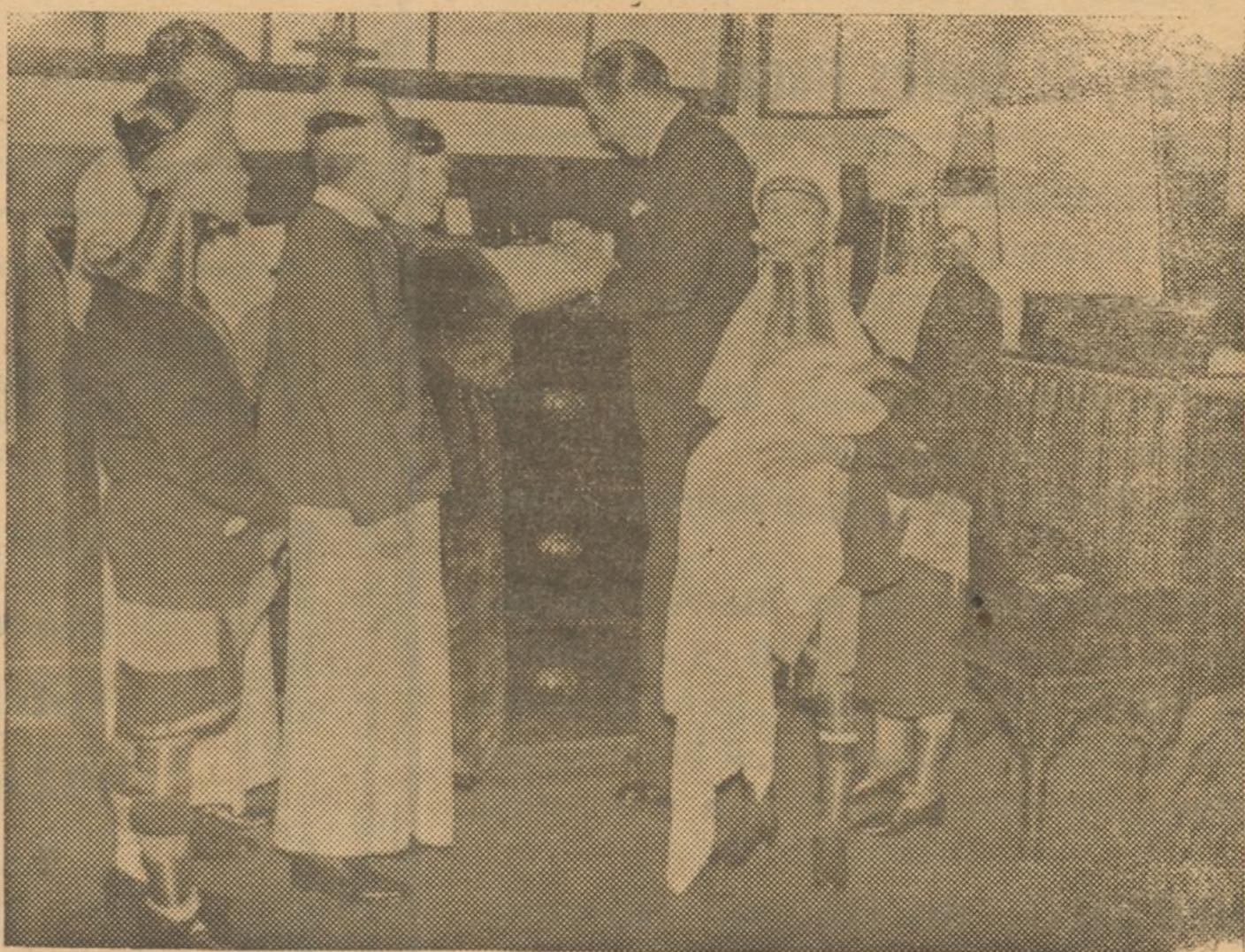
En la iglesia de San Aloysius de Glasgow (Escocia), ha tenido lugar el bautizo de una niña cuya madre y ascendientes tienen todos el cuello de una jirafa. Esta extraña familia, que pertenece a una tribu de una isla del Pacífico, trabaja actualmente en un circo que se halla recorriendo varias capitales escocesas.