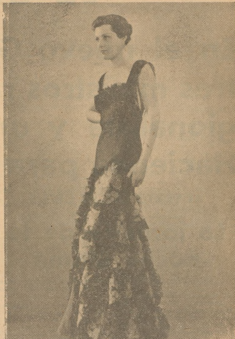
Traje de noche de la casa Jean Patou de París, confeccionado el cuerpo en organdi negro y la falda en el mismo color y tejido con grandes "bouquets" de colores diversos