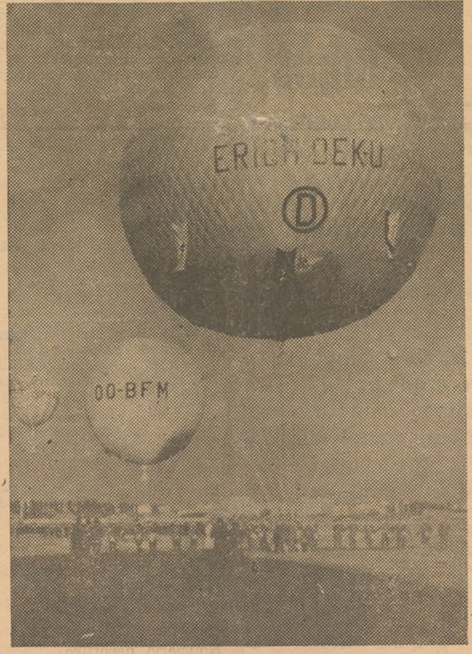
Los globos inscriptos para la Copa Gordon Bennet saliendo del aerodromo de Mokotov cerca de Varsovia. La salida fué presenciada por una enorme multitud.