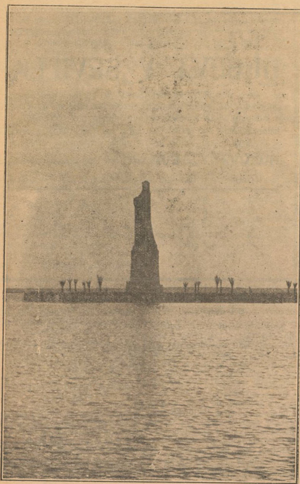
La impresionante estatua del descubridor contempla con nostalgia los mares que una vez surcó.

"Diario de Madrid" llegado ayer a Huelva nos sorprendió con la admirable crónica que reproducimos: