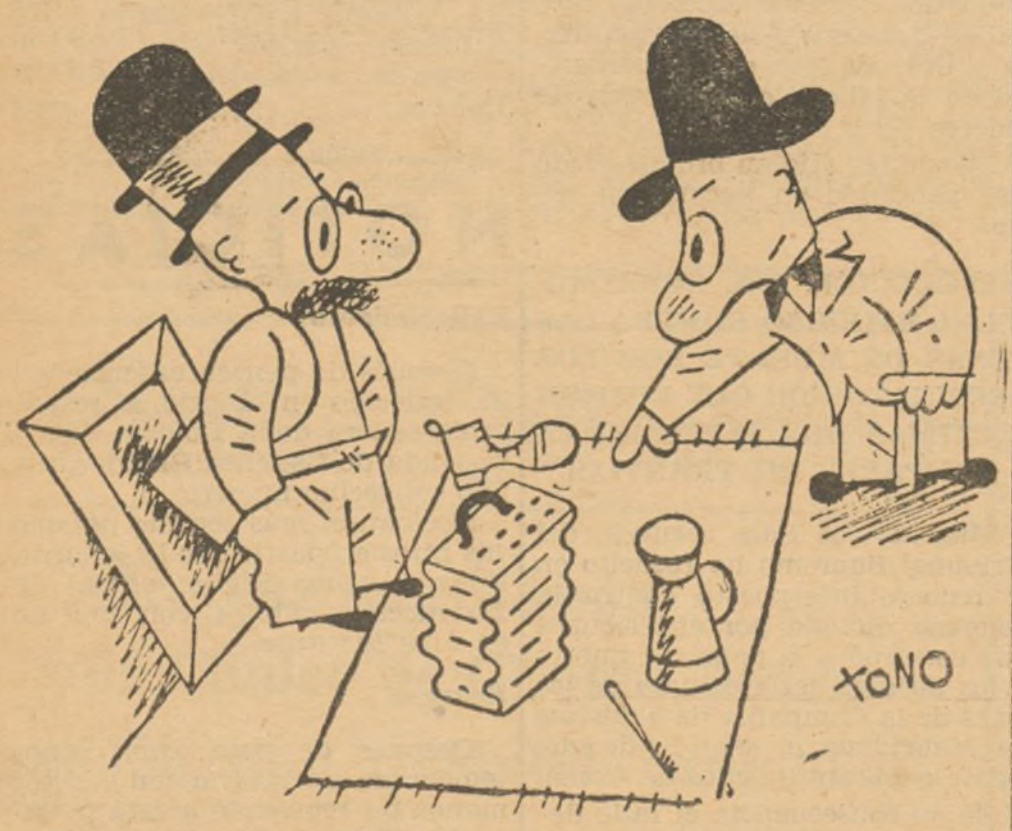
--¿Veinte francos por ese acordeón? ¿Con lo arrugado que está? (De "Ric et Rac", de París)