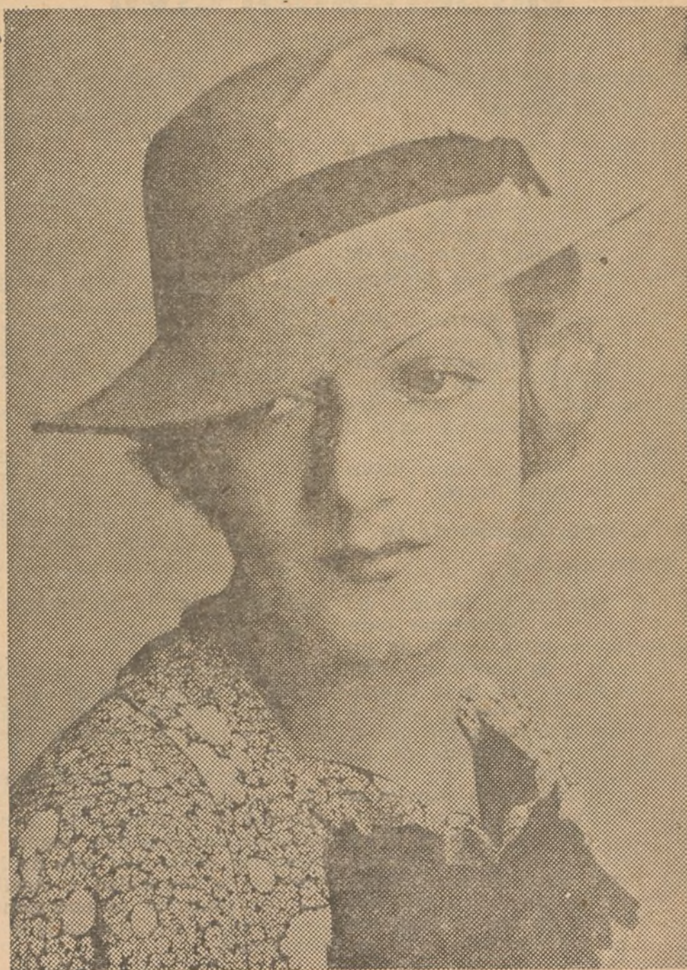
Sombrero modelo otoñal lanzado por una casa de moda inglesa en fieltro gris, con un pliegue en el casco y cinta azul marino.