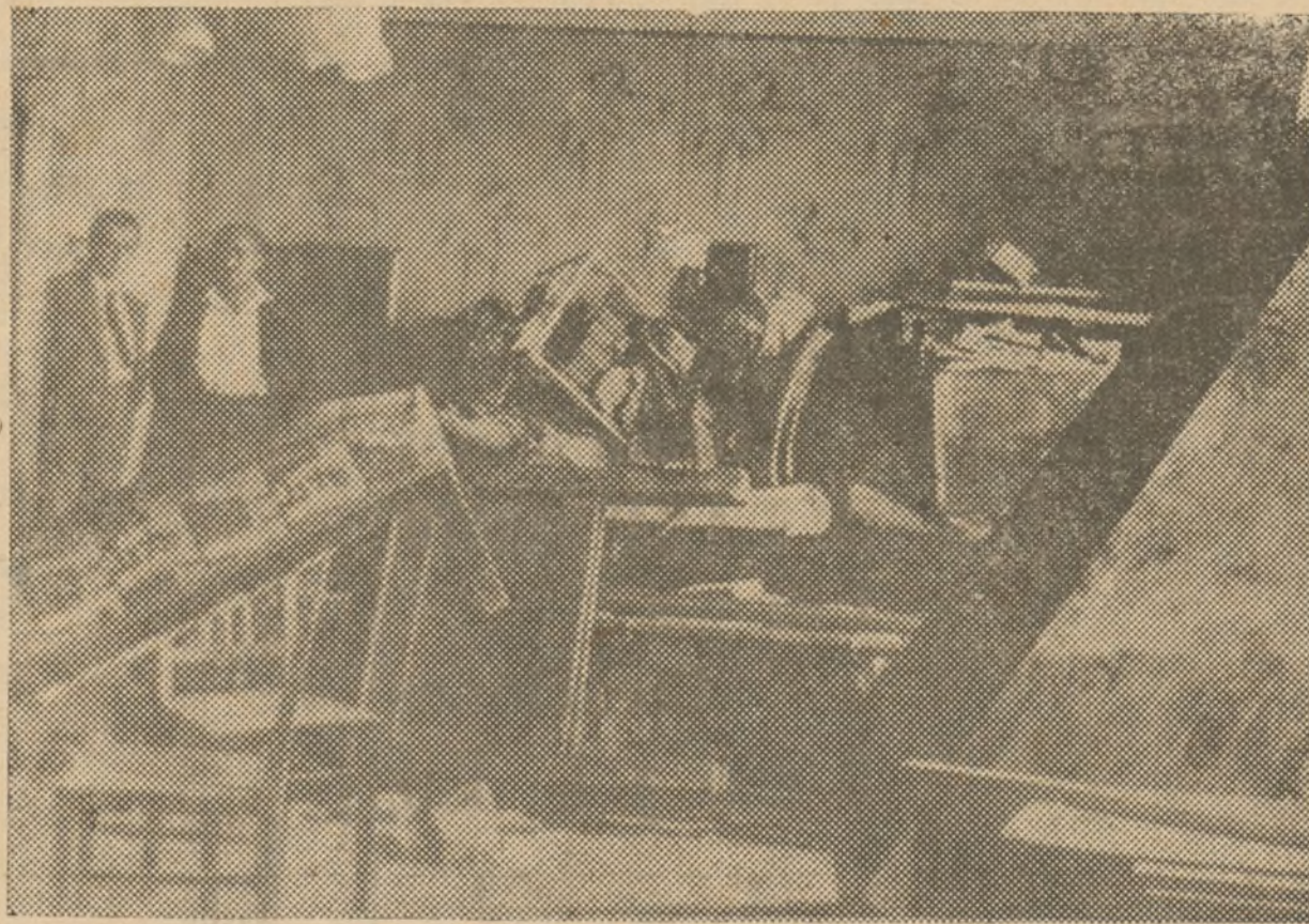
A causa de un fuerte escape de gas, se produjo una violenta explosión en una casa de Viena, resultando dos muertos y tres heridos de gravedad. Estado en que quedó una habitación de la casa después de la explosión.