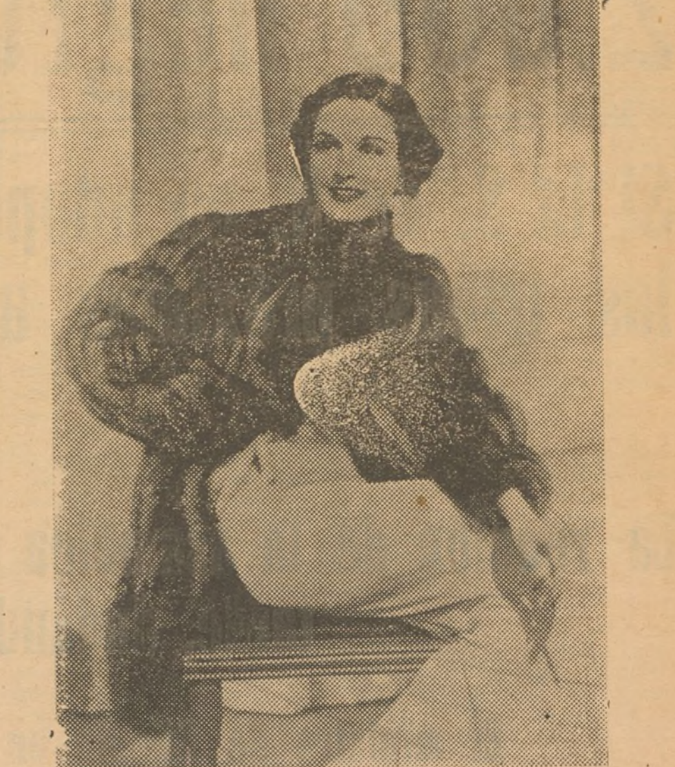
La famosa estrella de la pantalla Gail Patrick, luciendo una preciosa chaqueta de marfa, cuya novedad consiste en el cuello forma echarpe.