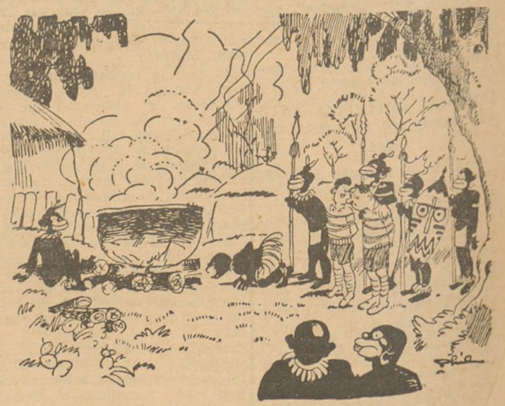
DUPONT ENTRE LOS CANIBALES

--Pues son más civilizados de lo que usted decía, capitán. Hasta nos están preparando un baño.