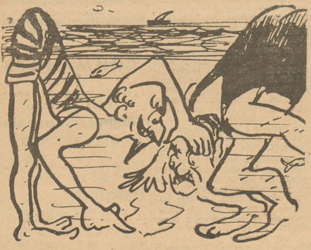
LA ESTRATEGIA A LA HORA DEL BAÑO