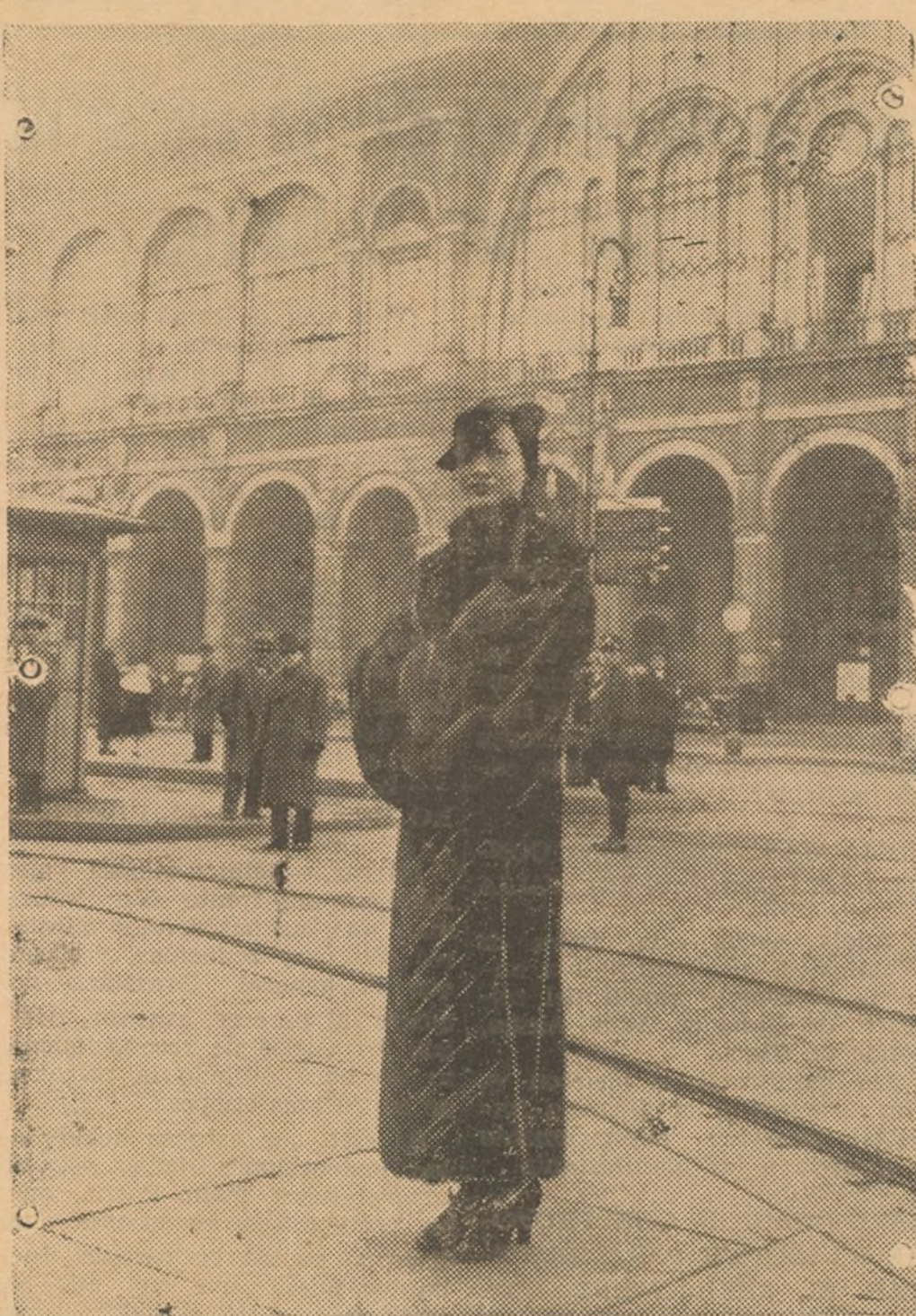
ANNA MAY WONG

A no ser por la gran fuerza de voluntad de este muchacho, hubiera tenido que estar la película suspendida durante más de 15 días, pero afortunadamente gracias al esfuerzo que realizó no estuvo más que tres o cuatro días no notándose en la actuación de Castel Rodrigo ningún defecto que pudiera menoscabar el mérito de su trabajo.