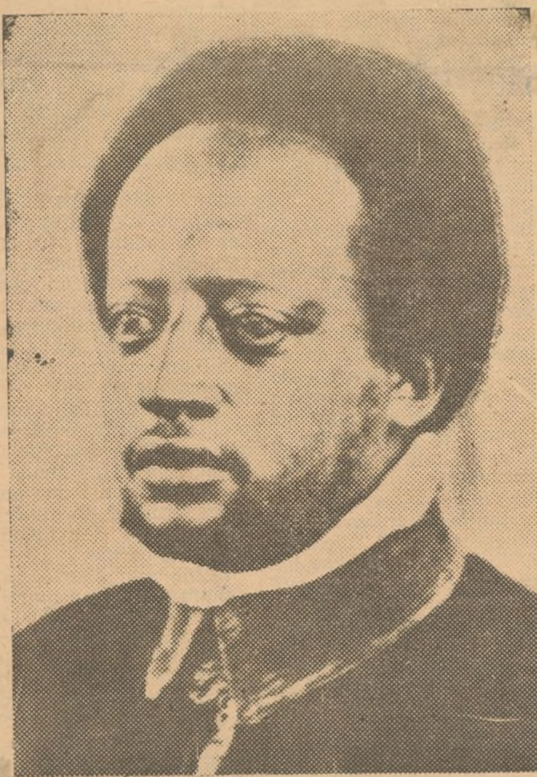
ROSTROS DE LA GUERRA

Inglaterra no sueña de ningún modo con un cierre del Canal de Suez ni con un bloqueo contra Italia.