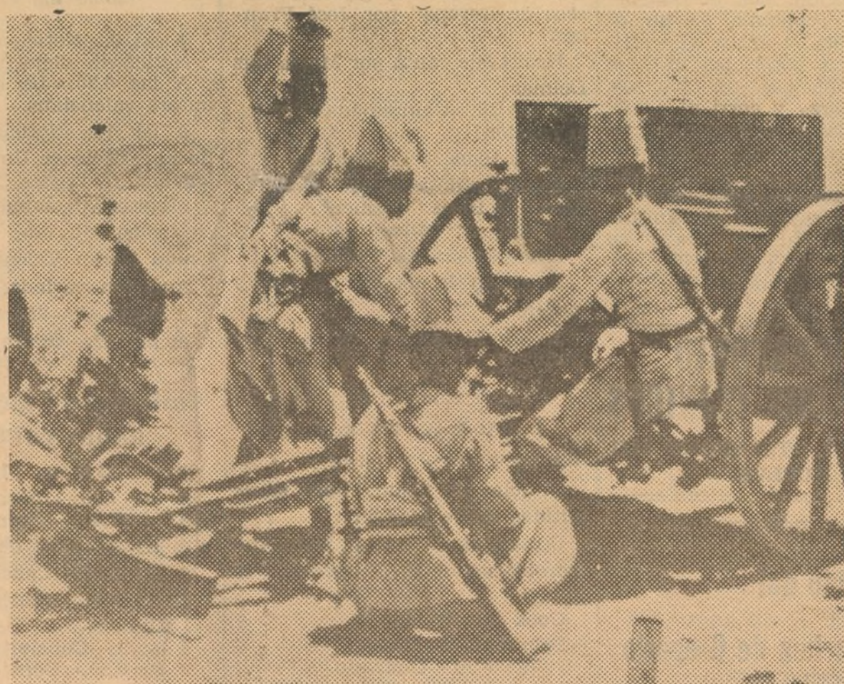
Un cañón italiano manejado por los "askaris" durante el bombardeo que precedió a la toma de Adua.