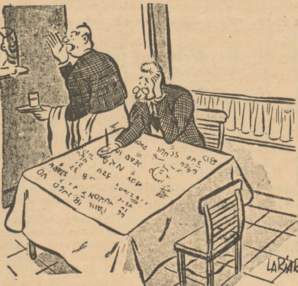
El camarero.—Una ensalada de tomate, un entrecot con patatas y un afilalápices!