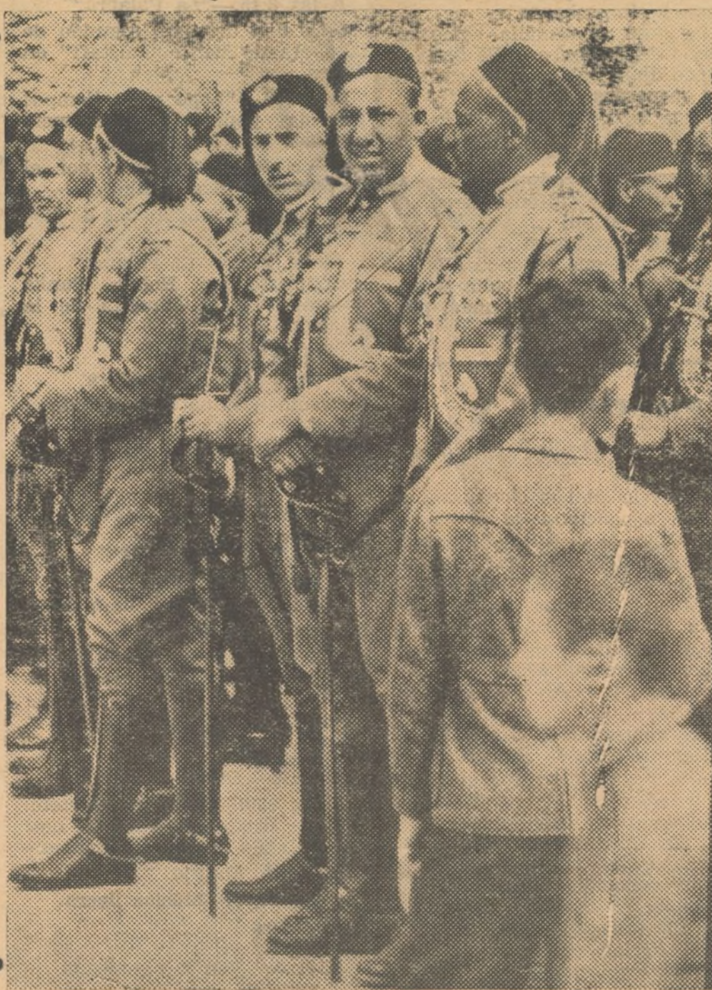
LA GUARDIA DEL MARISCAL BALBO

(Más información del conflicto italo etíope en séptima plana)