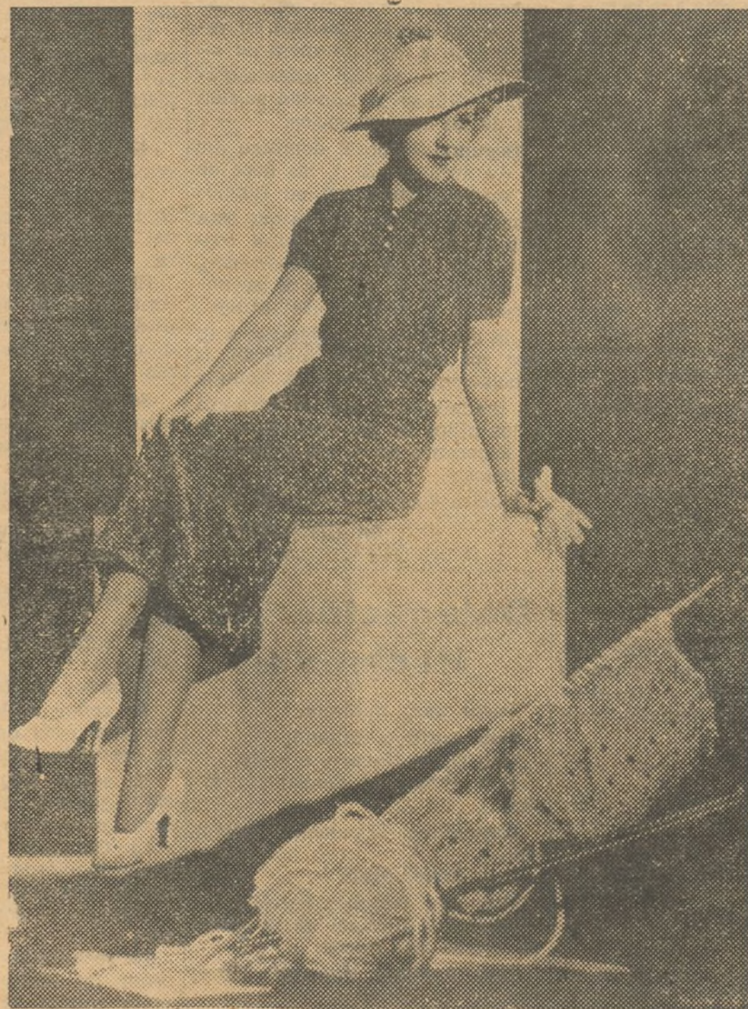
La rubia y encantadora estrella de la pantalla americana Betty Furness luce un bonito traje de punto de media hecho en lana azul marino con tonos blancos, confeccionado por ella misma durante sus horas libres. Este traje el cual resulta encantador para una jovencita puede ser ejecutado con gran facilidad por cualquier una de nuestras lectoras.-Aba jo muestra el punto del traje