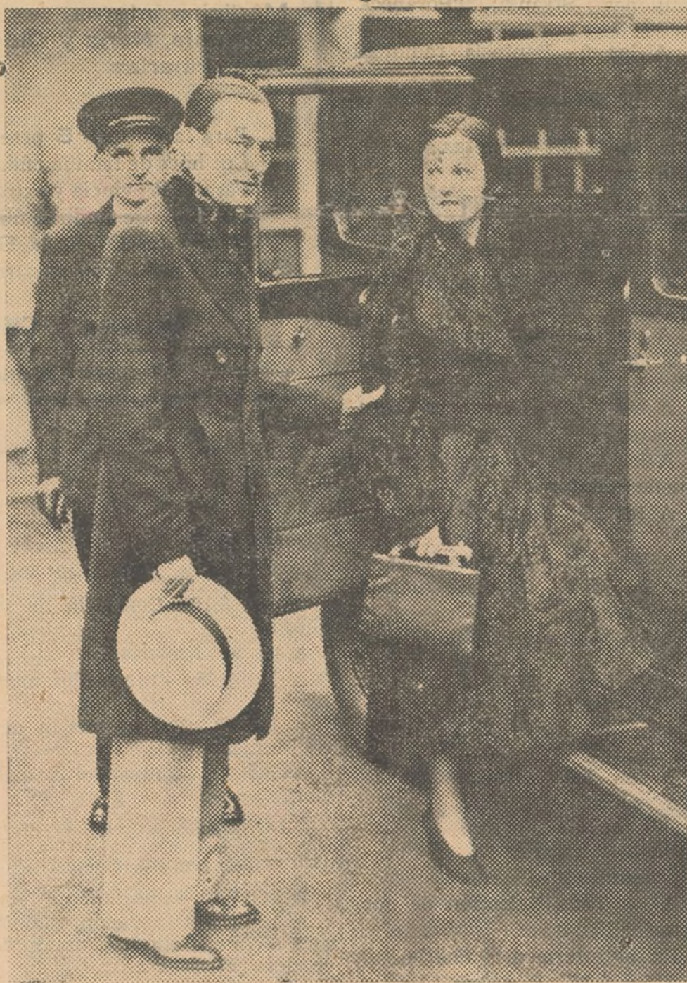
Jimmy Walker, el famoso ex-alcalde de Nueva-York, después de permanecer varios años en Londres regresa a la ciudad de los rascacielos, en compañía de su mujer la bella Betty Compton. He aquí al matrimonio al abandonar su hotel de Londres