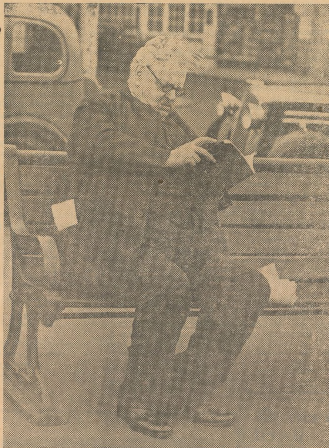
El famoso escritor inglés de fama mundial G. K. Chesterton, considerado como el mejor escritor de obras criminales, está actualmente escribiendo un nuevo libro. Chesterton tiene la costumbre de trabajar siempre al aire libre, teniendo predilección por los bancos de las plazas y paseos, pues dice es allí en donde mejor se inspira