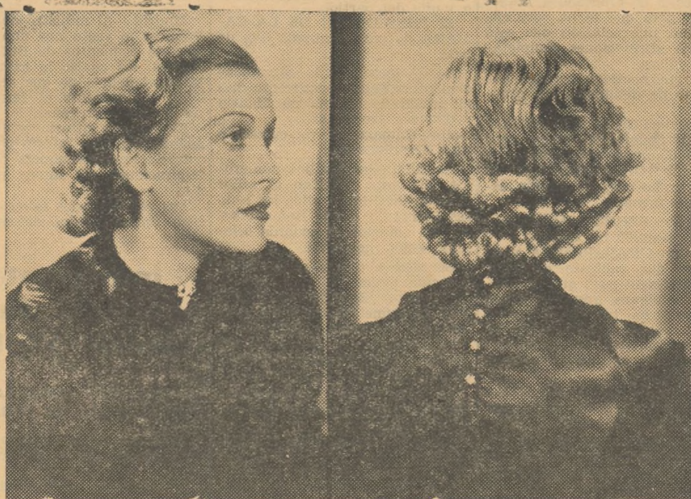
La rubia actriz de la pantalla americana Rosalinda Keith, lucidas un peinado muy sencillo pero que encuadra muy bien a todos los rostros. Grandes ondas al agua en la parte delantera de la cabeza yendo a parar a la nuca por encima de las orejas, para formar pequeños bucles. Este peinado puede emplearse tanto para la calle como para el baile.