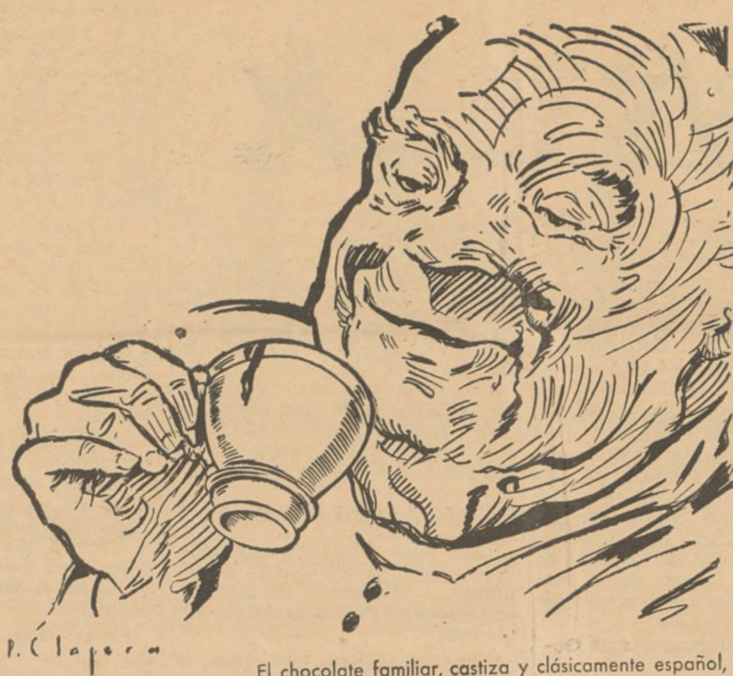
"Una jicara de chocolate 'Los Canónigos' es otra de las delicias de España."

Para terminar nos dice el señor Figueroa: Puede usted afirmar que el Claustro de profesores del Instituto dirigido por el señor Te