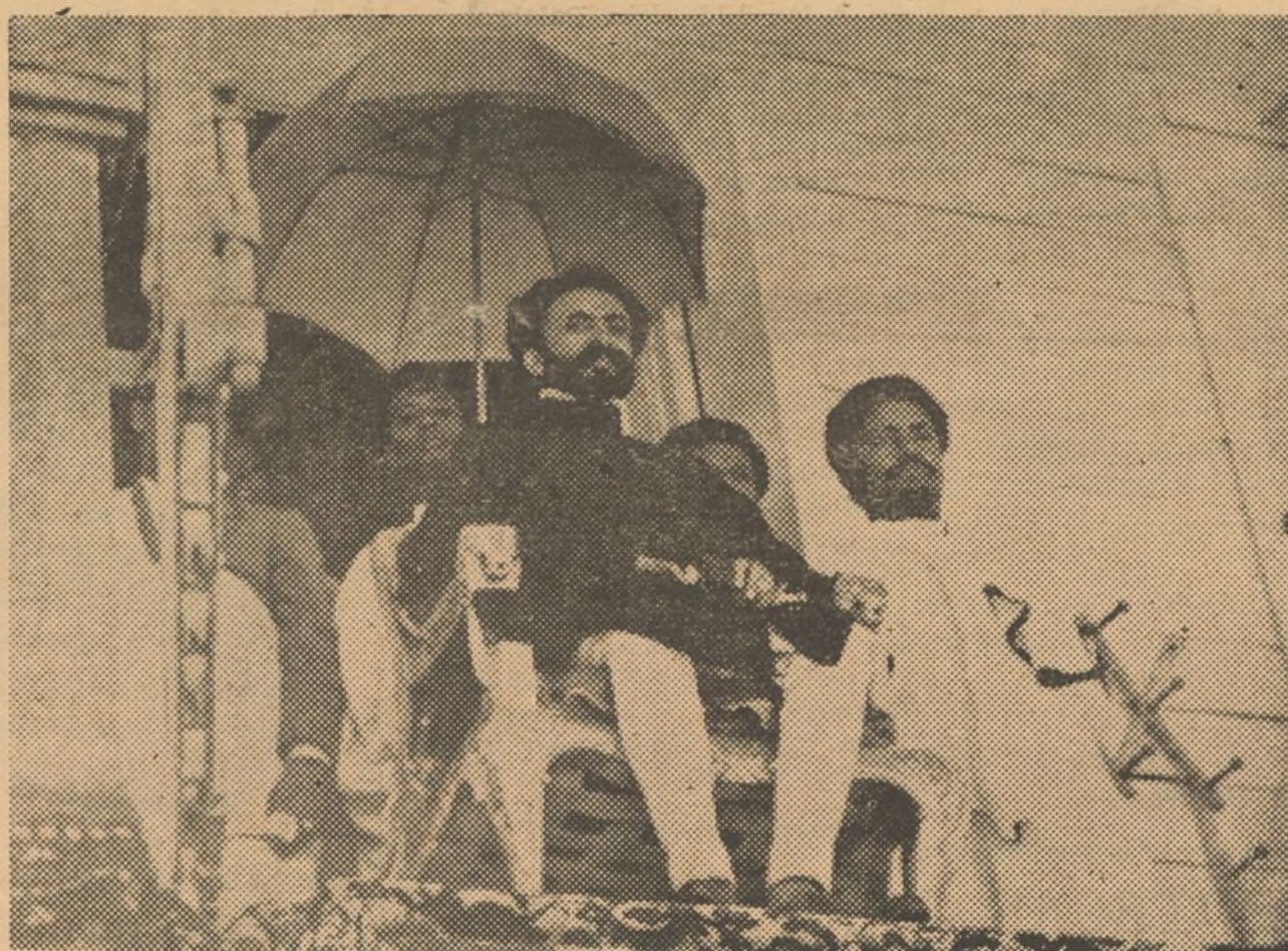
Haile Selassie, en la galería de su palacio durante una fiesta en la que jefes de tri- bus le declararon su fidelidad.