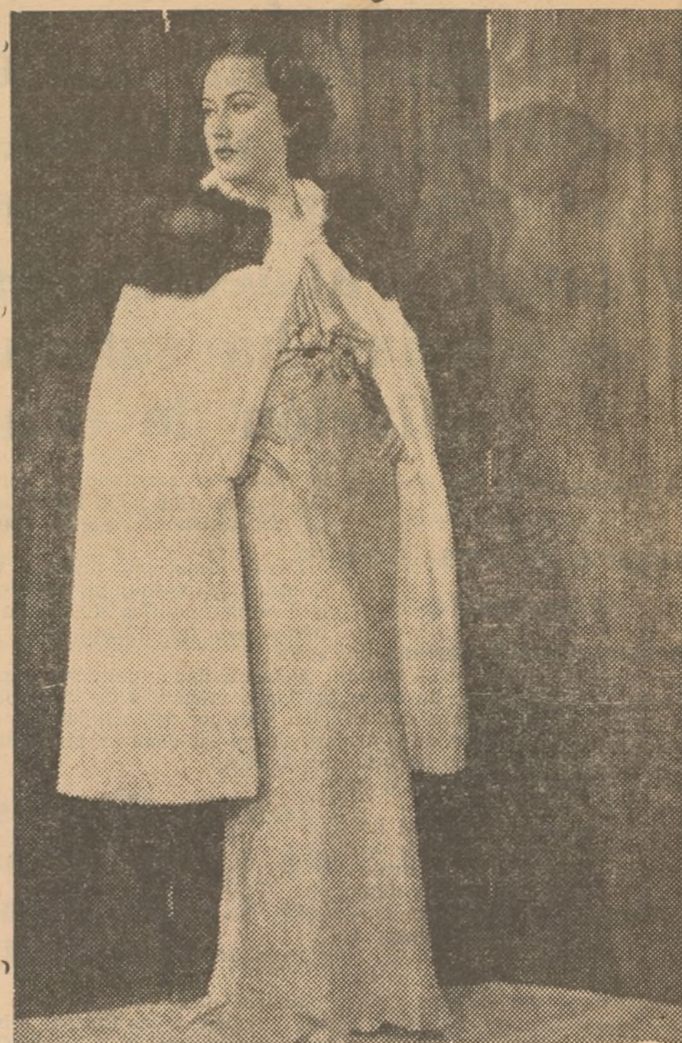
Bonito modelo de noche hecho en encaje blanco, de forma un poco acampanada por abajo, cinturón del mismo género con boina broche en pedrería blanca y negra. Completa el traje, una capa de armiño con cuello de zorro argentino. También es de bonito efecto y de coste mucho más reducido la capa confeccionada en terciopelo "chiffon" blanco con cuello de renardina negro.