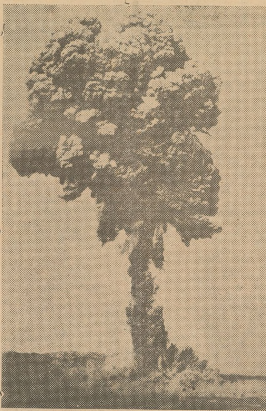
Fotografía tomada en el momento de ocurrir una formidable explosión en un depósito de municiones en el arsenal de Langchow (China), que destruyó centenares de casas causando víctimas numerosas.