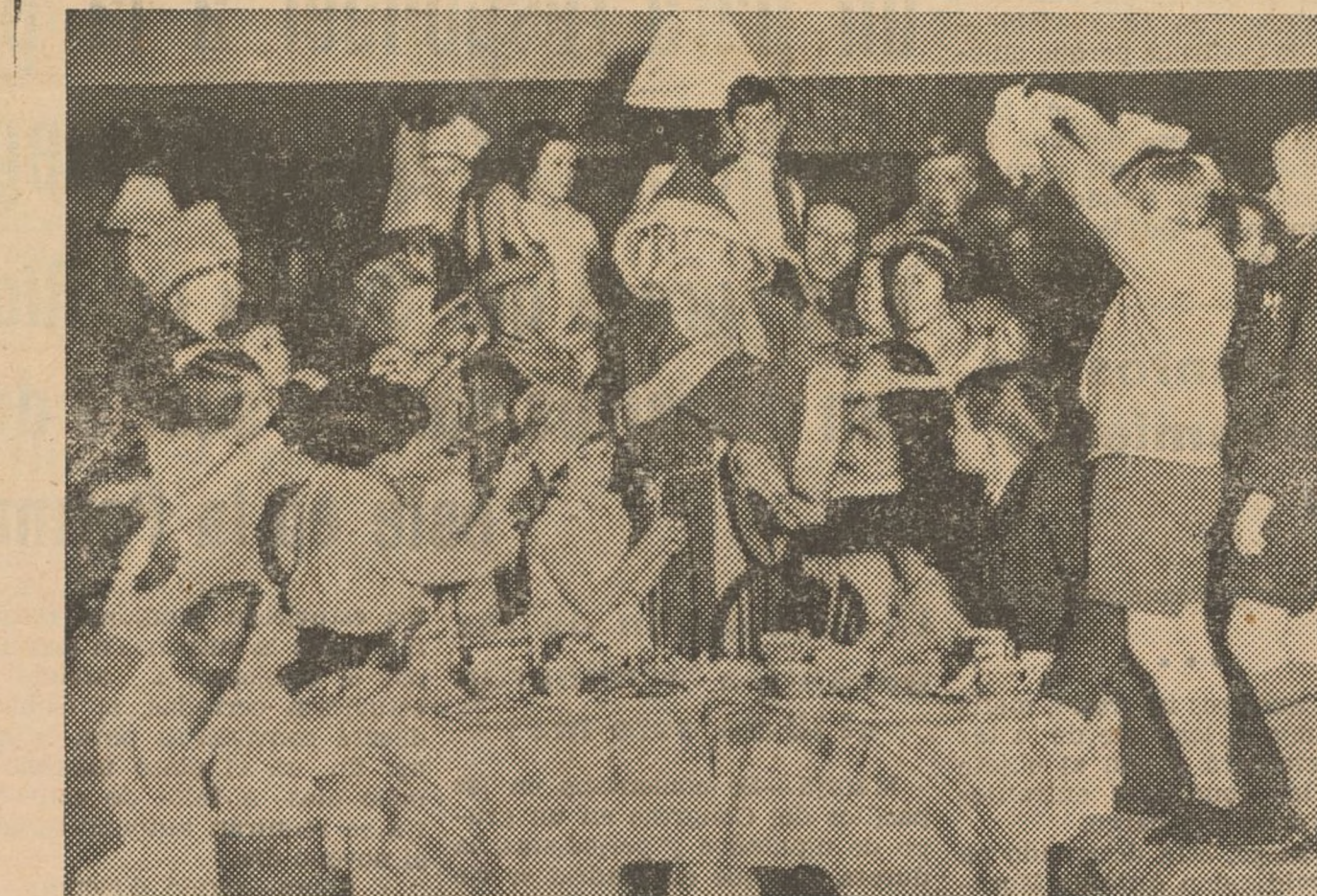
LILIAN HARVEY EN UN "NUEVO PAPEL"

Con motivo de las fiestas de Navidad la conocida actriz de la pantalla Lilian Harvey ha invitado a los niños de su distrito a una espléndida merienda vistiéndose ella de Padre Noel. Lilian Harvey, junto con los niños, repartiendo chocolates y dulces que hicieron la alegría de los pequeños.