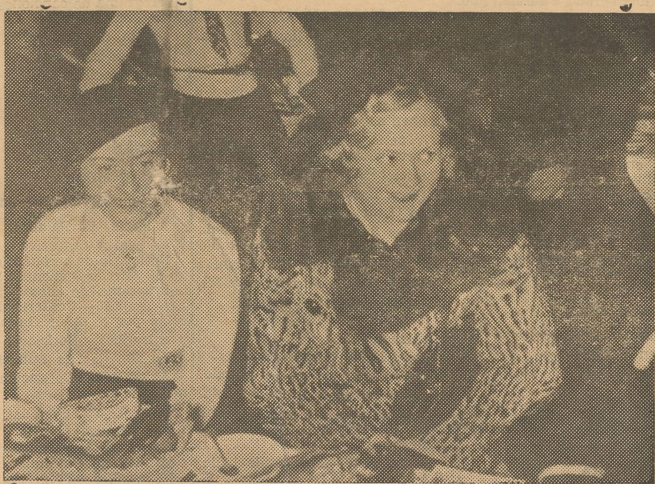
LA CAMPEONA MUNDIAL DE PATINAJE

—Entonces es que el Gobierno iba a ser derrotado, y en ese caso, naturalmente, no ha tenido otro camino que el que ha seguido.