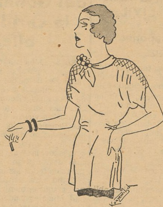
Elegante blusa de seda para noche.

Una mujer que se precie de ele- gante, sabrá elegir para cada ves- tido un guante apropiado, en la seguridad de que este pequeño