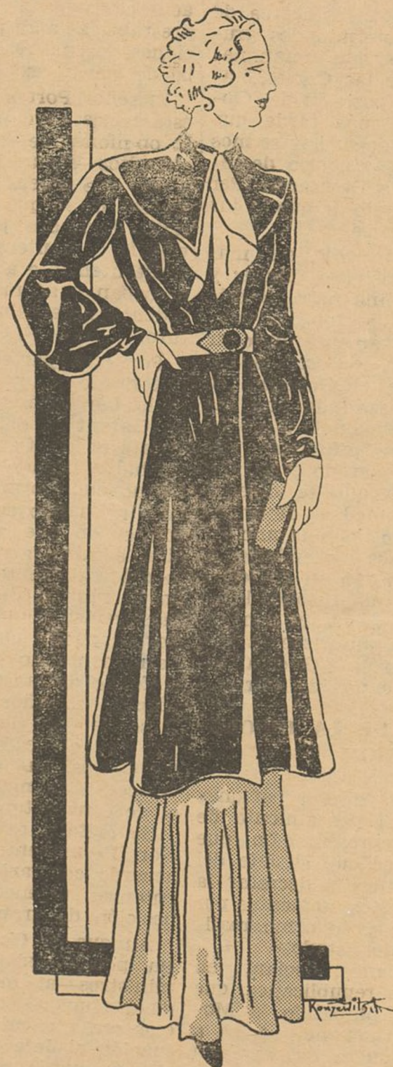
Elegante modelo de abrigo, "sa- lida de noche" con cinturón blan- co y lazo corbata también blan- co, de seda; lana negra.

dojos en un saquito de tela nue- va, (que se sumerge en un baño de aceite de oliva puro, durante veinticuatro horas. Acto segui- do, se mete el saquito en un ba- ño de agua jabonosa hirviendo, durante un cuarto de hora; se enjuaga con agua tibia, y se pa- sa por agua débilmente almido- nada. Después de estas operacio- nes se saca el encaje del saqui- to y se tiende para que se seque.