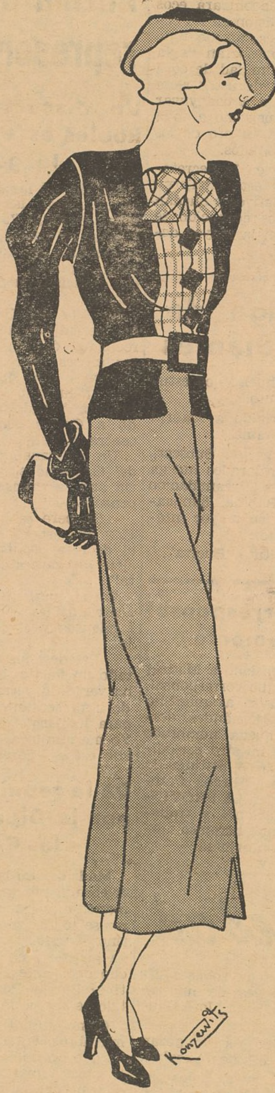
Sencillo vestido de chaquetilla con cinturón blanco. La falda, en azul claro, la chaqueta en negro y la blusilla en seda es- tampada a rayas cruzadas

detalle será el que le dé su perso- nal originalidad.