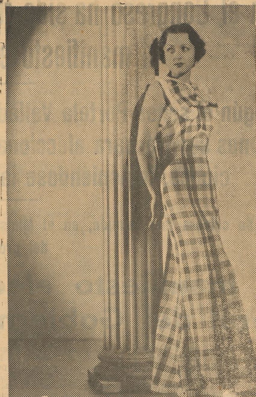
LINDO VESTIDO DE BAILE PARA JOVENCITA

Este modelo de vestido de baile que ofrecemos hoy a nuestras lectoras es un modelo muy juvenil apropiado para jovencitas de 15 a 20 años. El género es "crep inglés" con dibujo escocés en blanco, verde y rojo. Su forma es muy sencilla como se puede ver, falda recta con forma abajo. Lazo grande formando las alas de una mariposa con dos flores de orgadi blanco al medio de delante. Un diminuto volante plisado del mismo género del vestido, en blanco, adorna el borde de la falda, del lazo y el escote de las mangas.