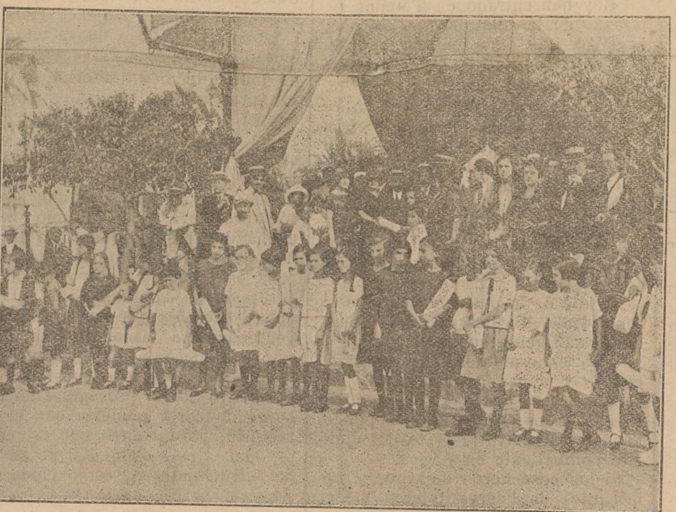
Las alumnas de la Colonia Escolar y directores de la misma en el acto de la entrega de premios