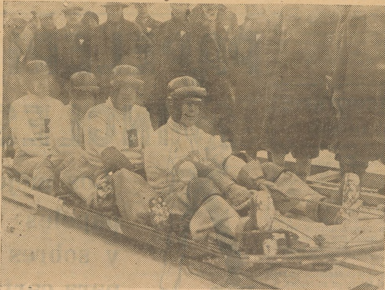
DE LA OLIMPIADA BLANCA