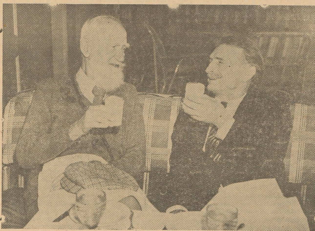
El célebre escritor Bernard Shaw en compañía del no menos célebre profesor de cultura física Bernard Macfadden, ha realizado un viaje de recreo recorriendo la campiña inglesa. George Bernard Shaw, durante su viaje, bebe un vaso de leche a la salud de su compañero