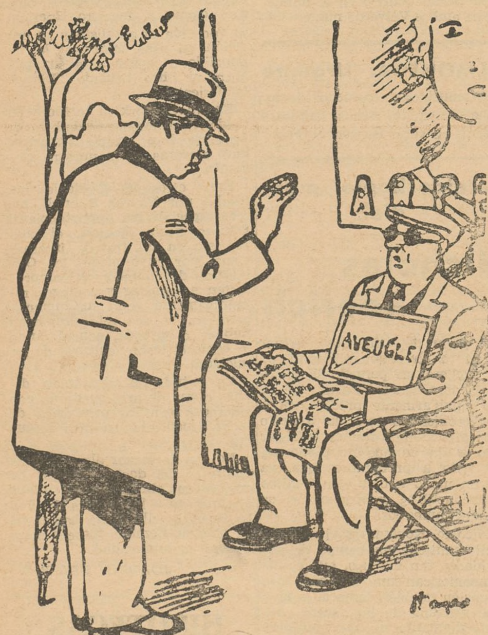
—¿De modo que es usted ciego y está leyendo un periódico? —Perdone, no lo leía; estaba viendo las fotografías.