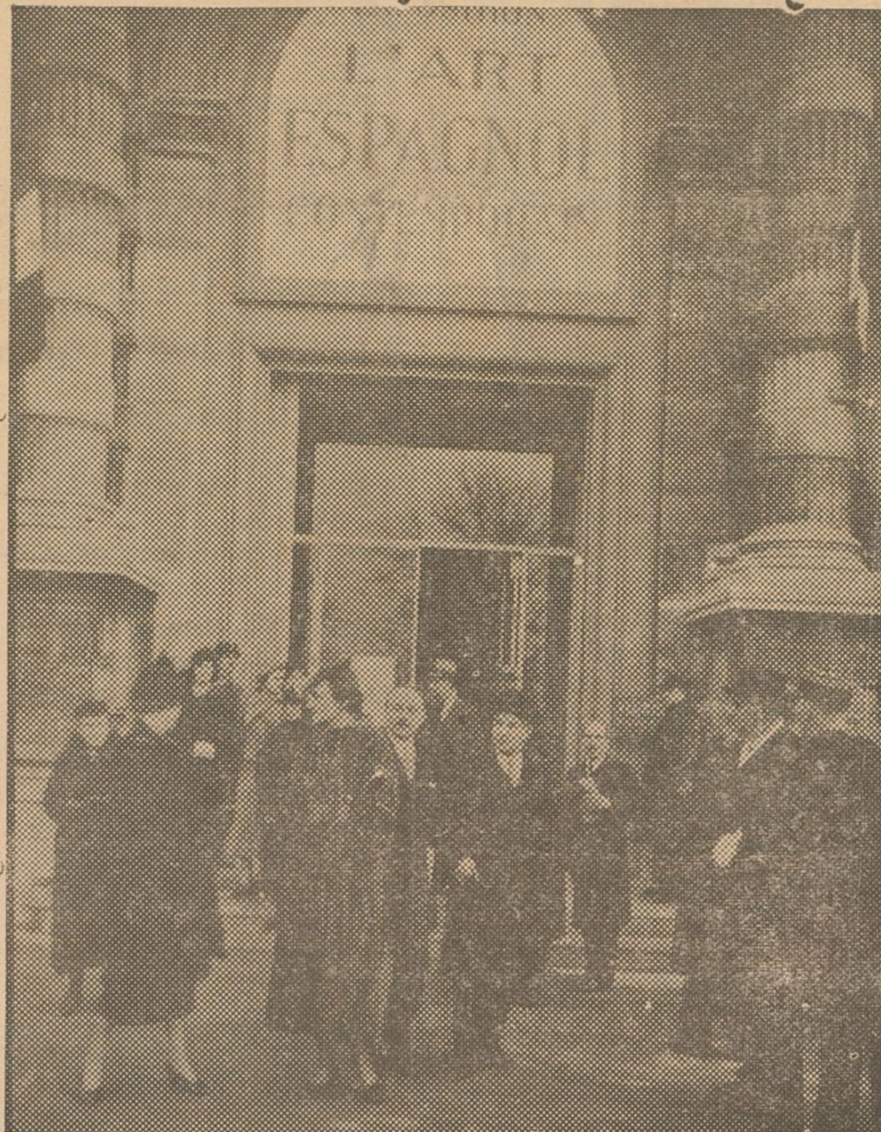
En el Museo del "Jeu de Paume" de las Tullerías, ha sido inaugurada con asistencia del embajador de España en Francia, señor Cárdenas y numerosas personalidades españolas y francesas, una exposición de Arte Español Contemporáneo. El señor Cárdenas, embajador de España saliendo de inaugurar la Exposición