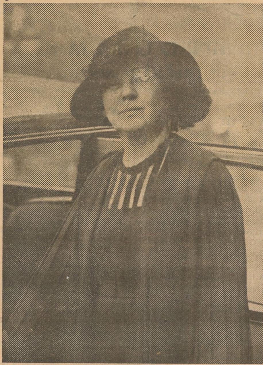
Uno de los actos democráticos que ha celebrado el rey Eduardo VIII, desde su ascensión al trono británico, ha sido entregar la insignia de Dama de Honor del Imperio Británico a Miss Christabel Pankhurst, una de las primeras mujeres sufragistas de antes de la Gran Guerra. La ceremonia se celebró en el Palacio de Buckingham.