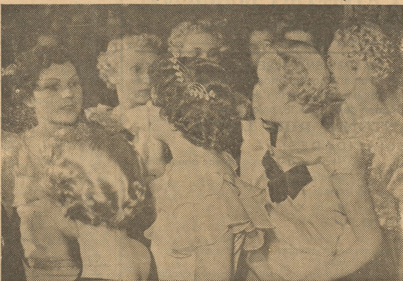
En un elegante salón de París se ha celebrado un concurso de peinados en el que presentaron sus modelos los más afamados peluqueros de la Ville-Lumière. En la "foto" vemos a varios modelos de los muchos presentados.

Prepárese en coctelera: Hielo picado. Seis u ocho gotas de Angostura. Media copita de vermut. Media copita de dry gin. Agítese y sírvase en copa de cocktail.