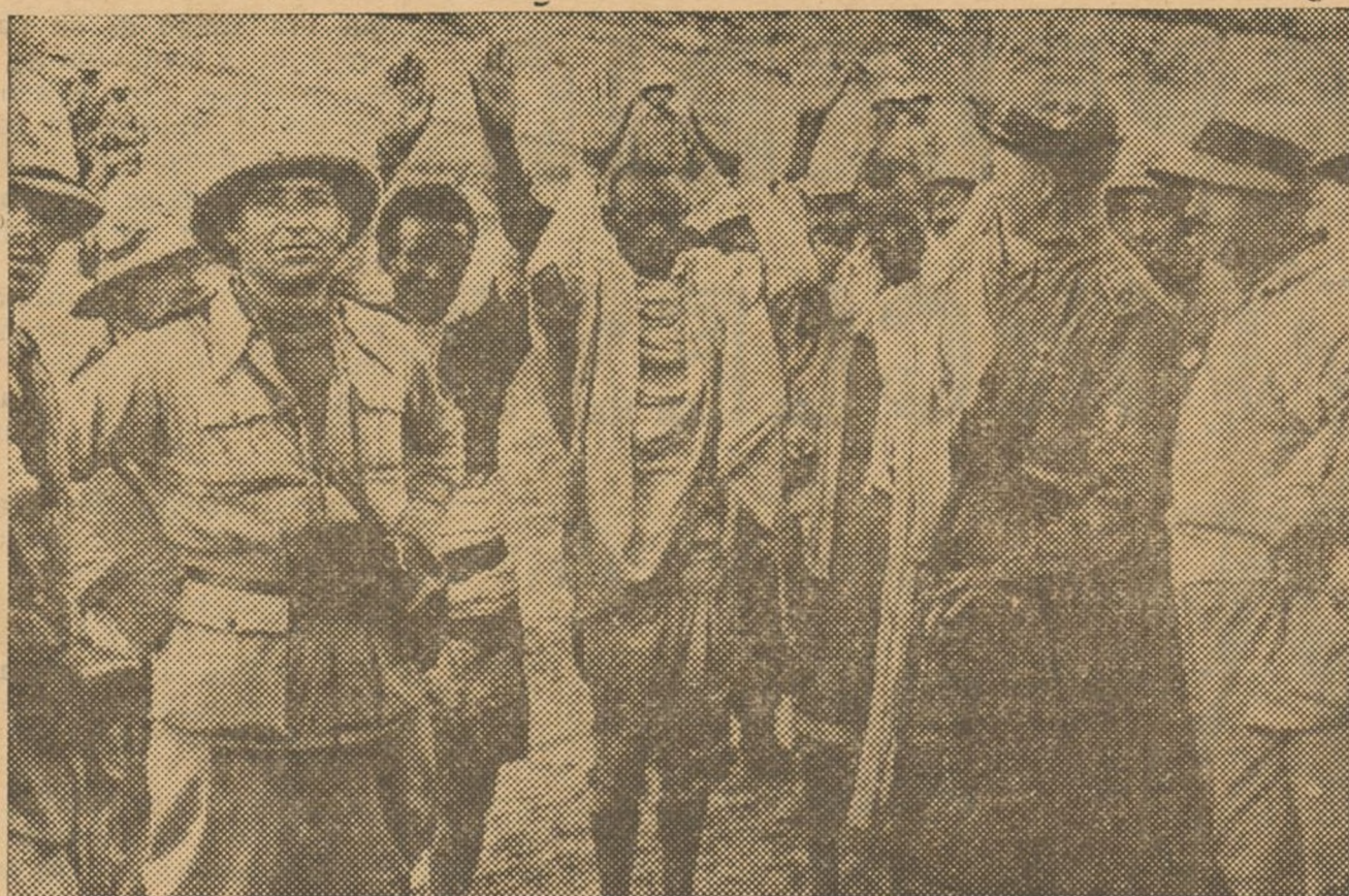
Guerreros etíopes hechos prisioneros por los italianos en una cueva del monte Aradam.