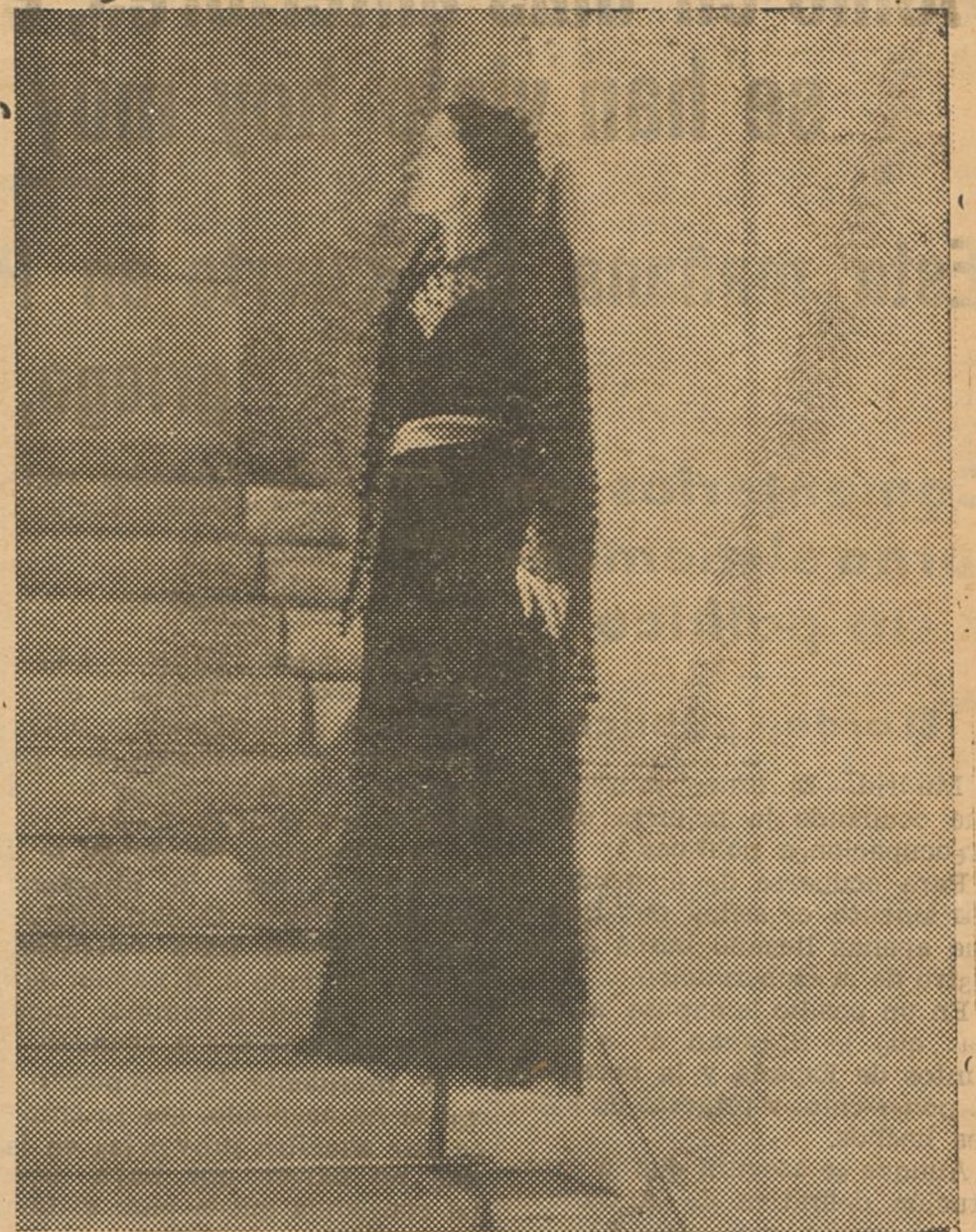
INFLUENCIA ESPAÑOLA EN LA MODA

Un tercio de vasito de coñac. Un tercio de vasito de whisky. Agítose y sírvase en copa de coctail, con una corteza de limón.