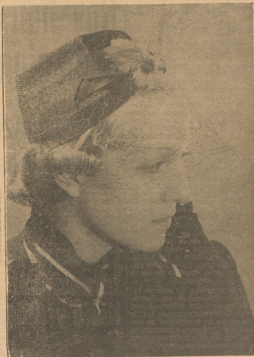
Lindo modelo de sombrero de verano en paja muy fina negra, con cinta "gros-grain" del mismo color que termina en un lazo en la parte delantera donde lleva una linda fantasía de plumas de colores