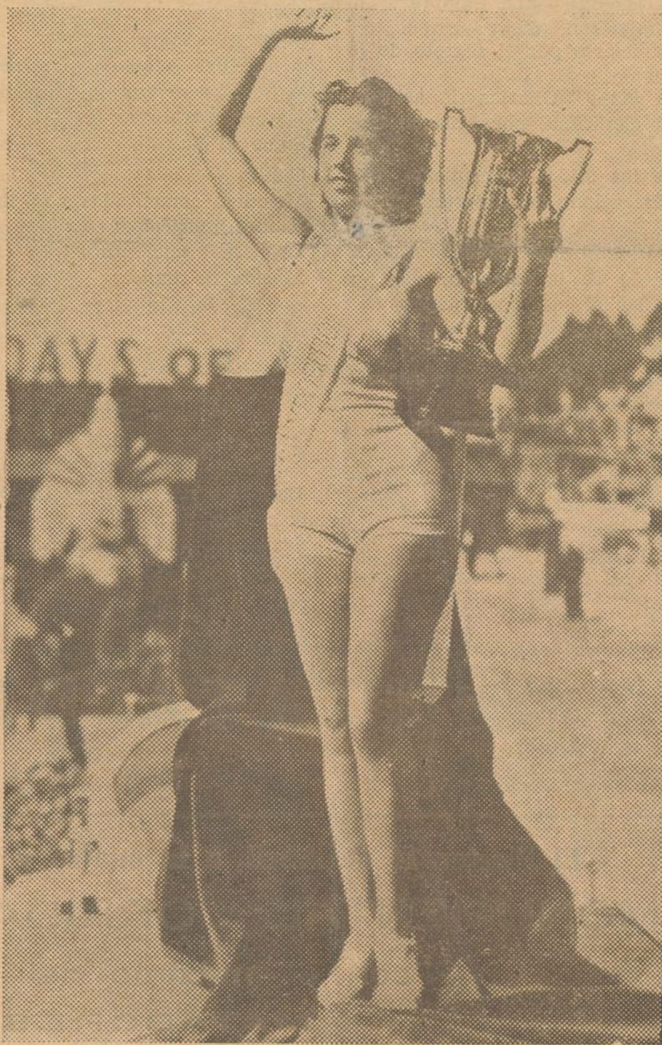
En la exposición que anualmente se celebra en San Francisco de California con el nombre de "Pacific International Exhibition", ha sido elegida "Miss Exposición" esta bella señorita que ostenta orgullosa el trofeo de su victoria.