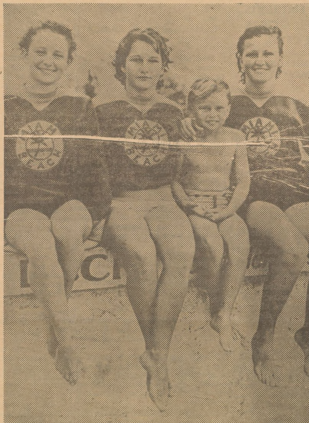
Las hermanas Rawls forman parte del equipo de natación que los Estados Unidos han designado para tomar parte en los Juegos Olímpicos que han de celebrarse en Berlín el próximo mes de agosto.