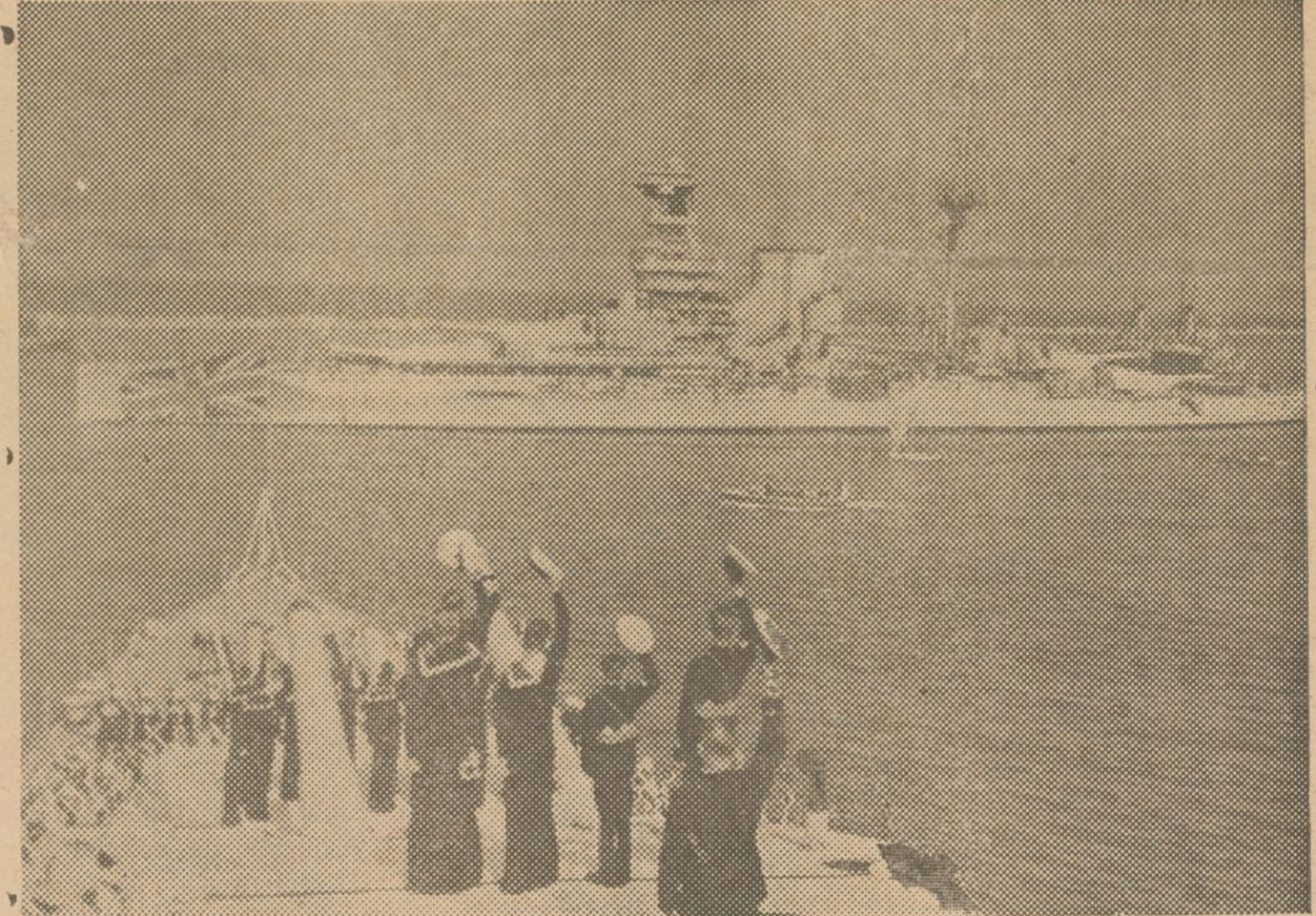
El buque-almirante de la escuadra inglesa "Queen Elizabeth" a su salida del puerto de Alejandría de regreso a Inglaterra, es saludado por la tripulación de los buques de guerra británicos que se encuentran en aquellas aguas.