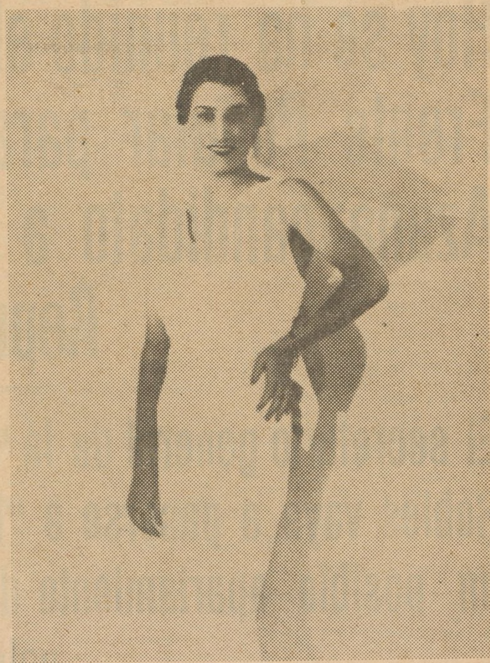
MISS UNIVERSO 1936 La señorita Carlota Wassel, de Alejandria, elegida «Miss Universo 1936» luce en esta «foto» un sencillo traje de noche blanco

Prepárese en coctelera: Unos pedacitos de hielo. Cuatro gotas de angostura. Una copa de gordon gin. Una raja de limón. Agítese bien y sírvase en copa de cock-tail, llenándola de agua de borines. Prepárese en coctelera: Unos pedacitos de hielo picado. Un cuarto de copa de gin gordon. Un cuarto de copita de vermut francés. Un cuarto de copita de vermut de cora. Un cuarto de copita de vermut Campanari. Agítese y sírvase en copa de cocktail.