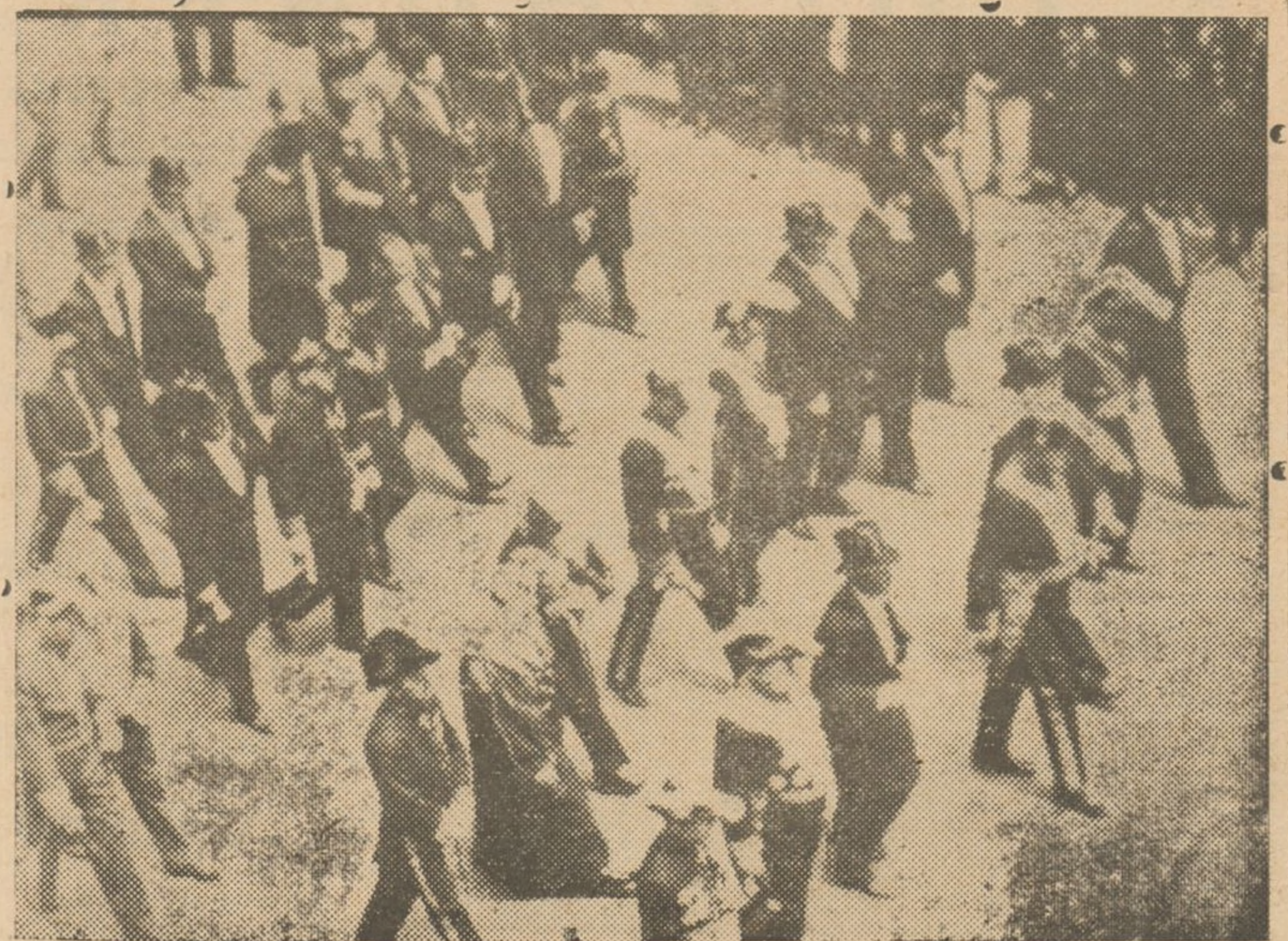
En las ceremonias propias del rito oriental y revistiendo gran pompa ha tenido lugar en El Cairo el acto de dar sepultura al cadáver del rey Fuad. En el fúnebre cortejo figuraban representaciones diplomáticas de numerosos países.