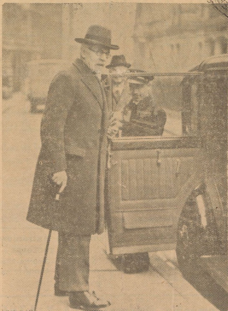
Mrs. Ramsay Macdonald, ex primer ministro británico, saliendo de la clínica londinense donde ha sufrido una intervención quirúrgica. El estado de Mr. Macdonald es muy satisfactorio