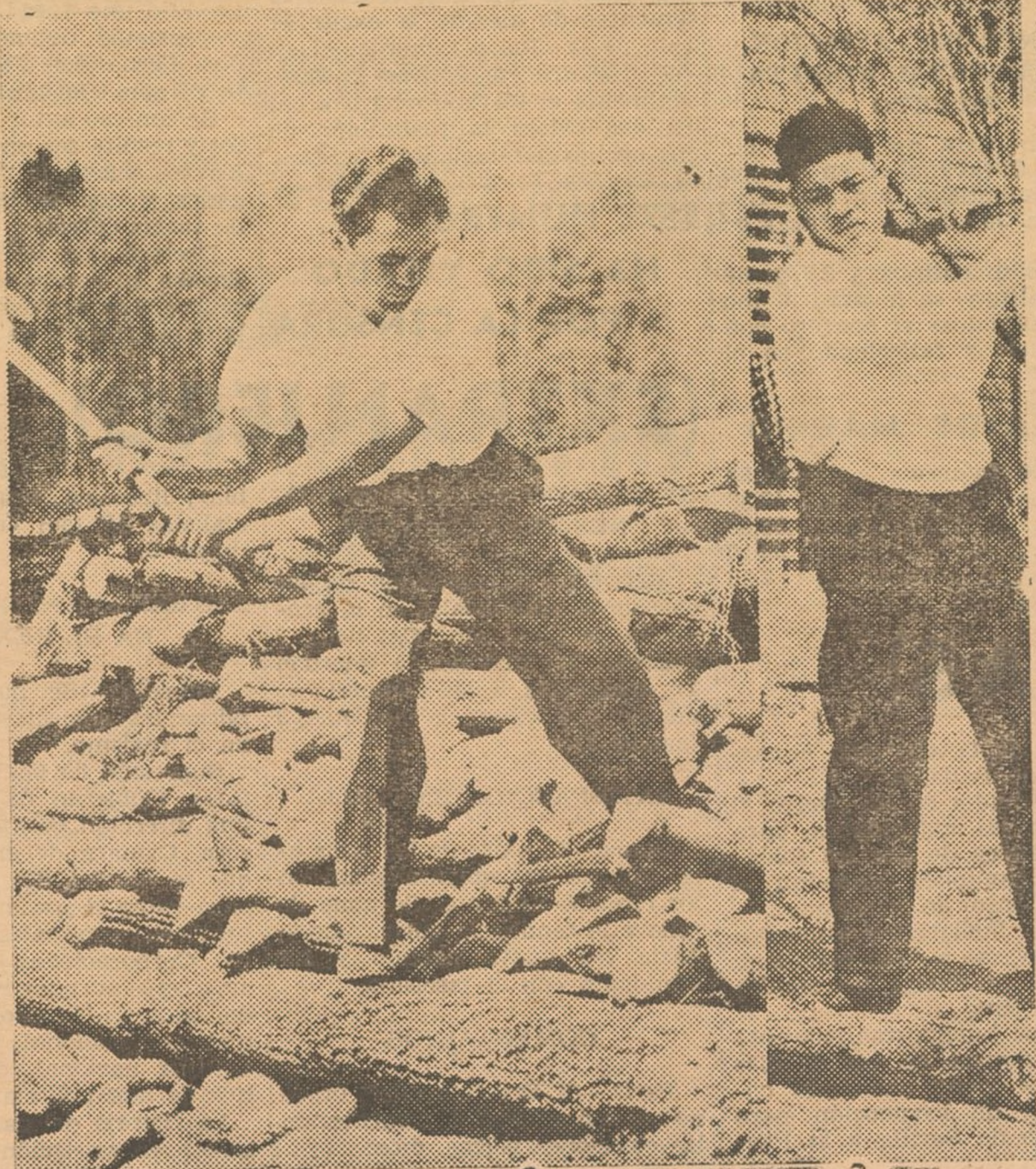
El día 18 del próximo mes de Junio tendrá lugar en Nueva York, un sensacional match de boxeo entre Joe Louis y Max Schmeling, los cuales se encuentran sometidos a un duro entrenamiento como se aprecia en la presente "foto" donde vemos, a la izquierda a Schmeling y a la derecha a Louis.