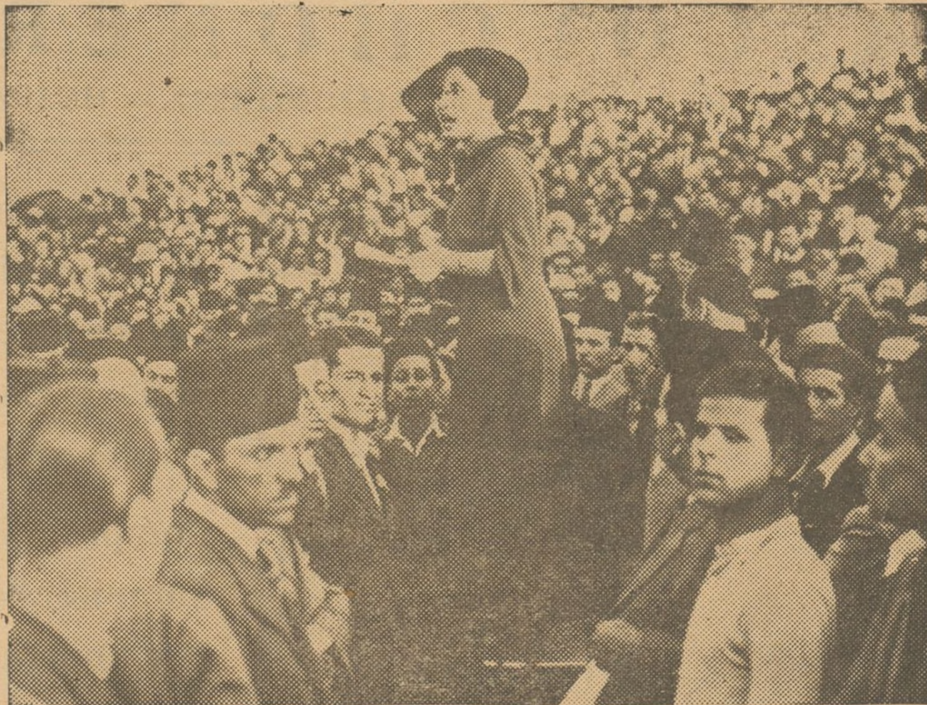
Recientemente se ha celebrado en Siria el 20 aniversario de su independencia. Aquí vemos a una señorita pronunciando en el cementerio de Beyrouth un discurso en memoria de los mártires de aquella