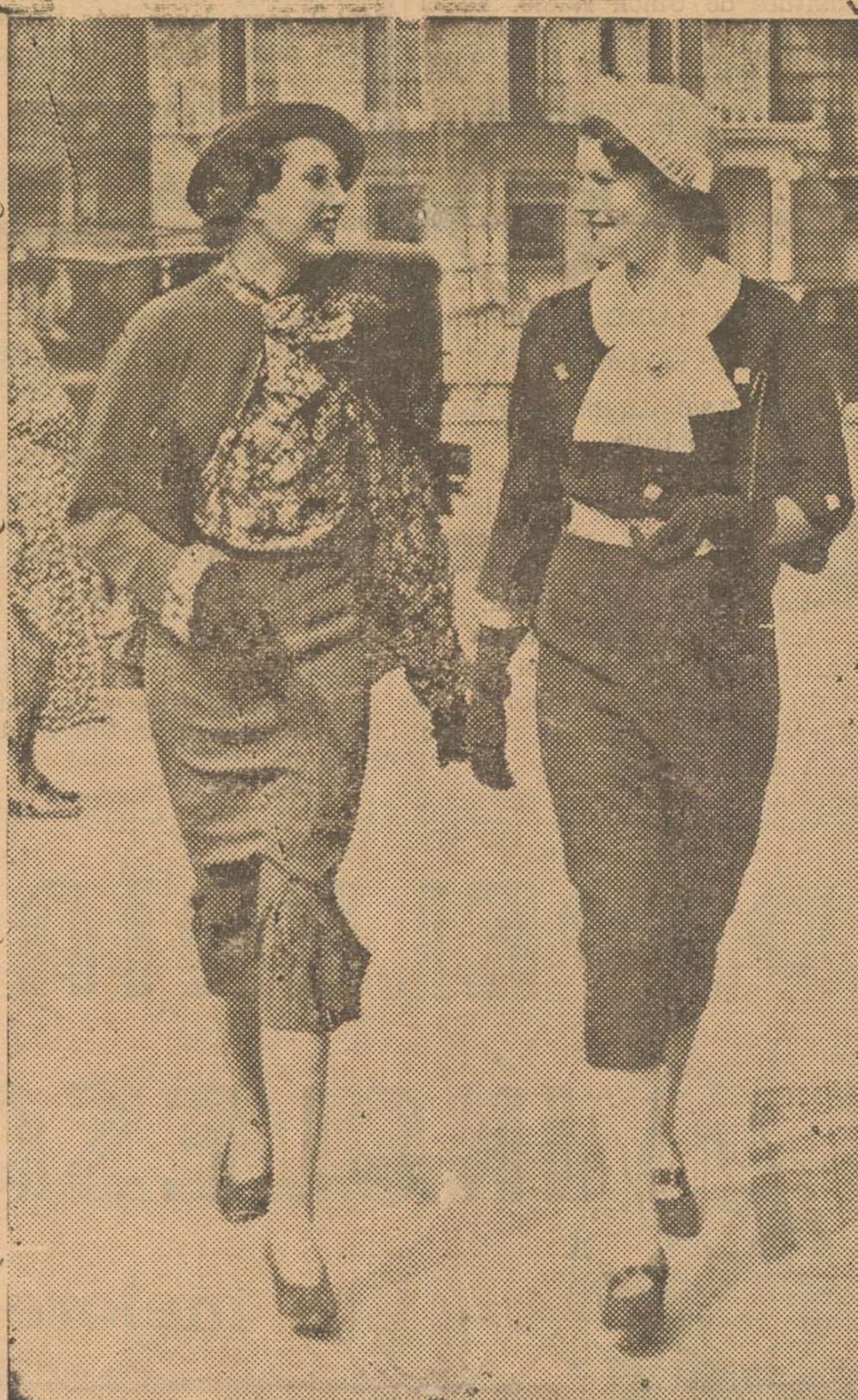
Estas dos señoritas que más bien parecen maniqués de una casa de modas son, sencillamente, las elegidas como anunciadoras por la B. B. C. de Londres, para el servicio de televisión que acaba de inaugurarse.