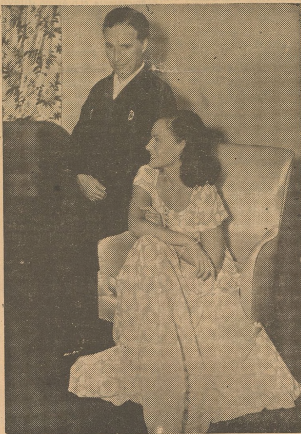
"Charlot" fuera de la pantalla no es más que el afortunado Mr. Charlie Chaplin, como aquí lo vemos en la intimidad con su última y encantadora esposa Paulette Goddard