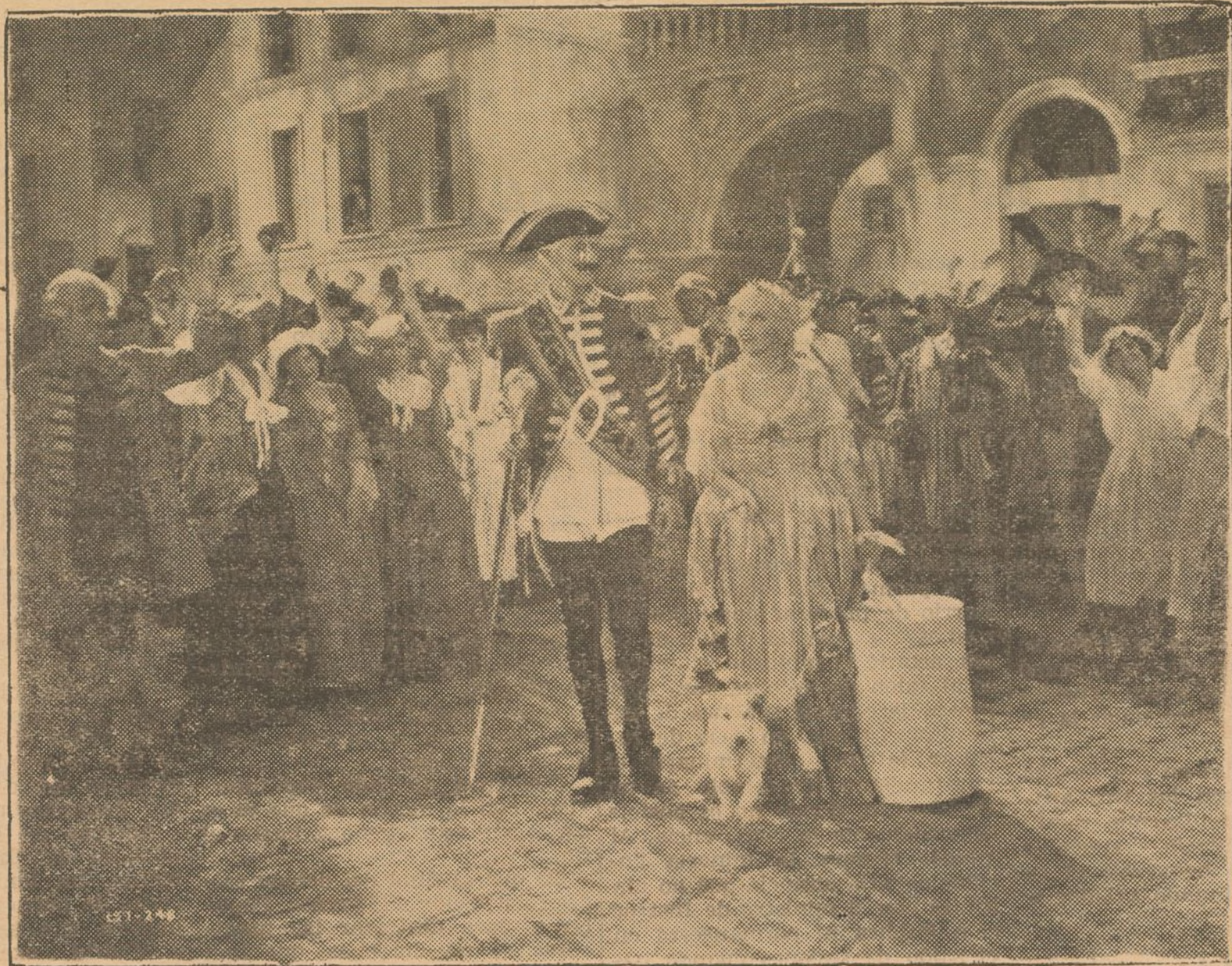
Una brillante escena de la magnífica producción extranjera "Yo te doy mi corazón" que la valenciana entidad "Cifesa" distribuye en España

SI ES USTED AFICIONADO AL CINE, LEA TODOS LOS SABADOS ESTA PAGINA