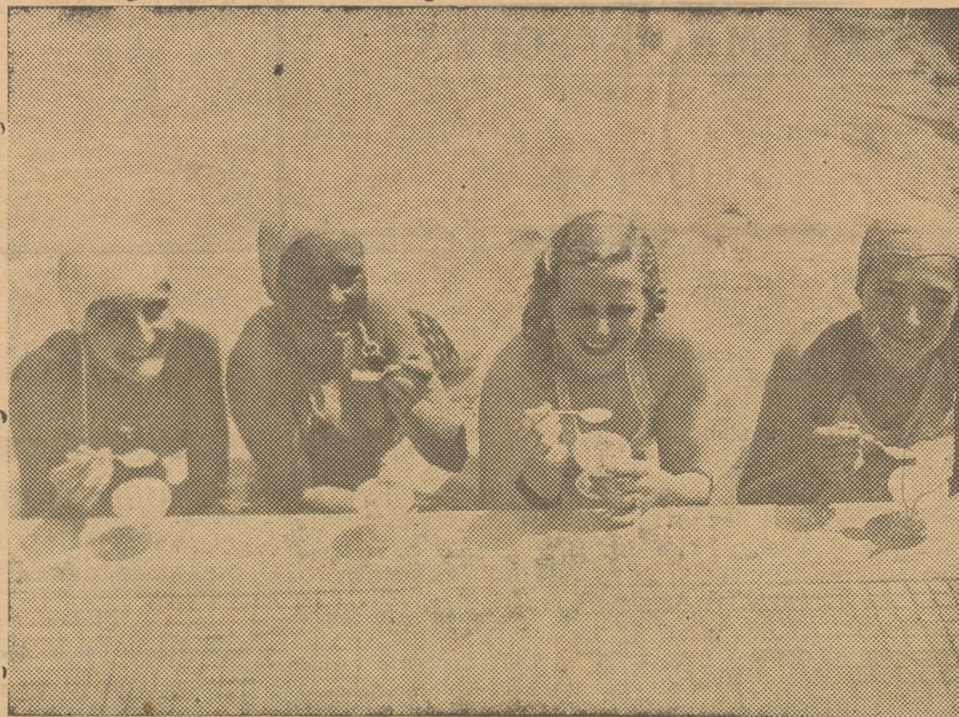
Mientras aquí en España hemos venido padeciendo un tiempo otoñal, en Inglaterra han disfrutado de una excelente temperatura, lo que ha permitido a estas lindas "girls" comenzar su temporada de baños con la degustación de agradables estimulantes.