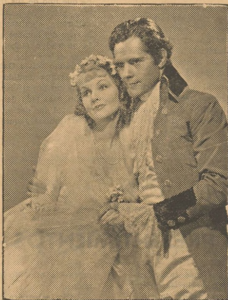
Lucía Manette y Carlos Darnay.