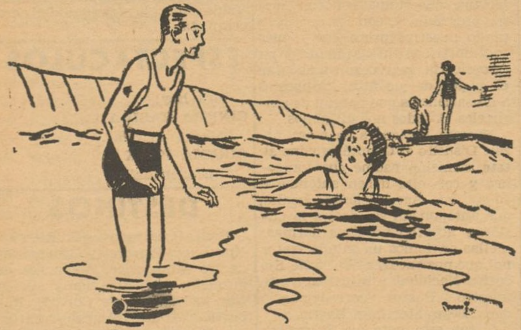
—No aprenderá usted nunca a nadar si no cierra la boca. —¡Insolente! ¿Quién es usted para mandarme callar?