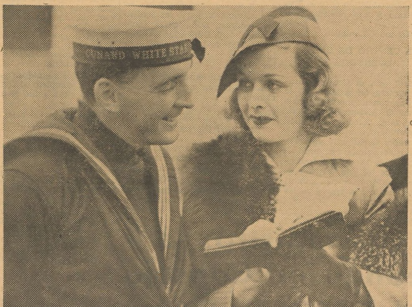
La famosa estrella de la pantalla Joan Bennet, firma en el libro de autógrafos de un marinero del buque que la ha traído a Europa.