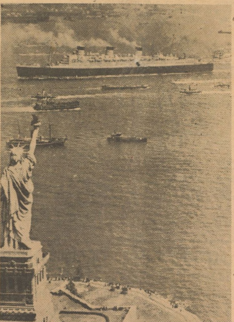
El gigantesco transatlántico "Queen Mary" a su entrada en el puerto de Nueva York, en su primera travesía del Atlántico, en la que invirtió 4 días, 12 horas y 24 minutos, saliendo de Southampton.