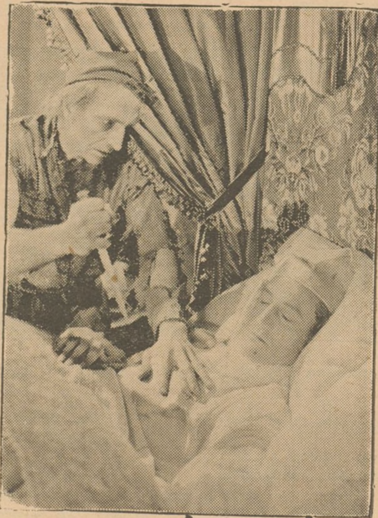
El marqués de Evrémonde fué asesinado.