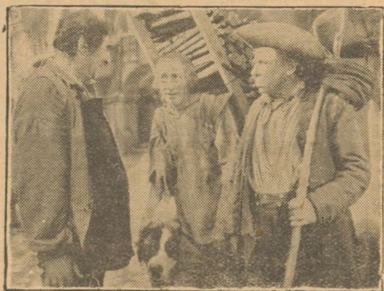
...entró un leñador llevando al hombro una gavilla de leña.

—Pues... lo conocí en Inglate- rra. Tiene una hija encantado- ra... y una nieta desde hace po- cos años.