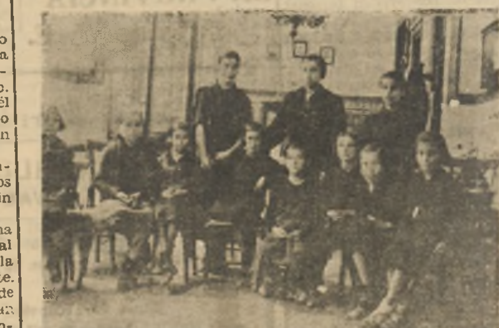
La Delegada de «La Casa del Flecha» con las diez primeras niñas huérfanas ingresadas por esta institución en un Colegio