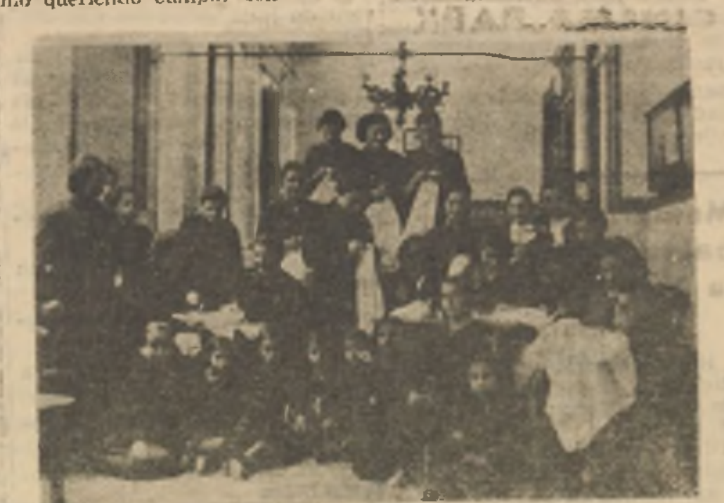
Un grupo de camaradas de la Sección Femenina de costura, trabajando para «La Casa del Flecha»