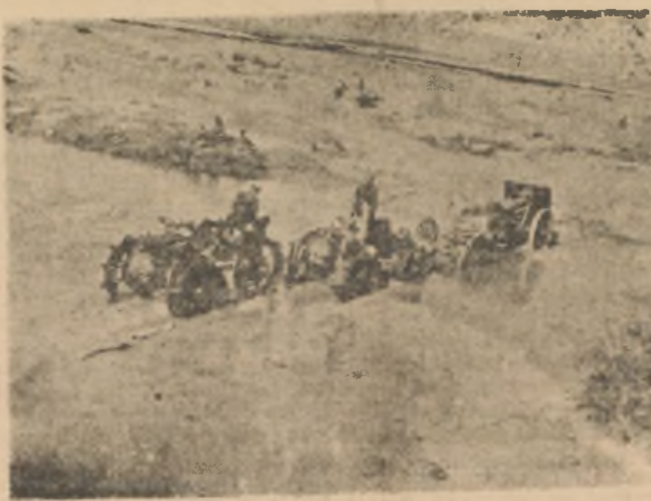
Las gloriosas tropas nacionales, vadean un río.