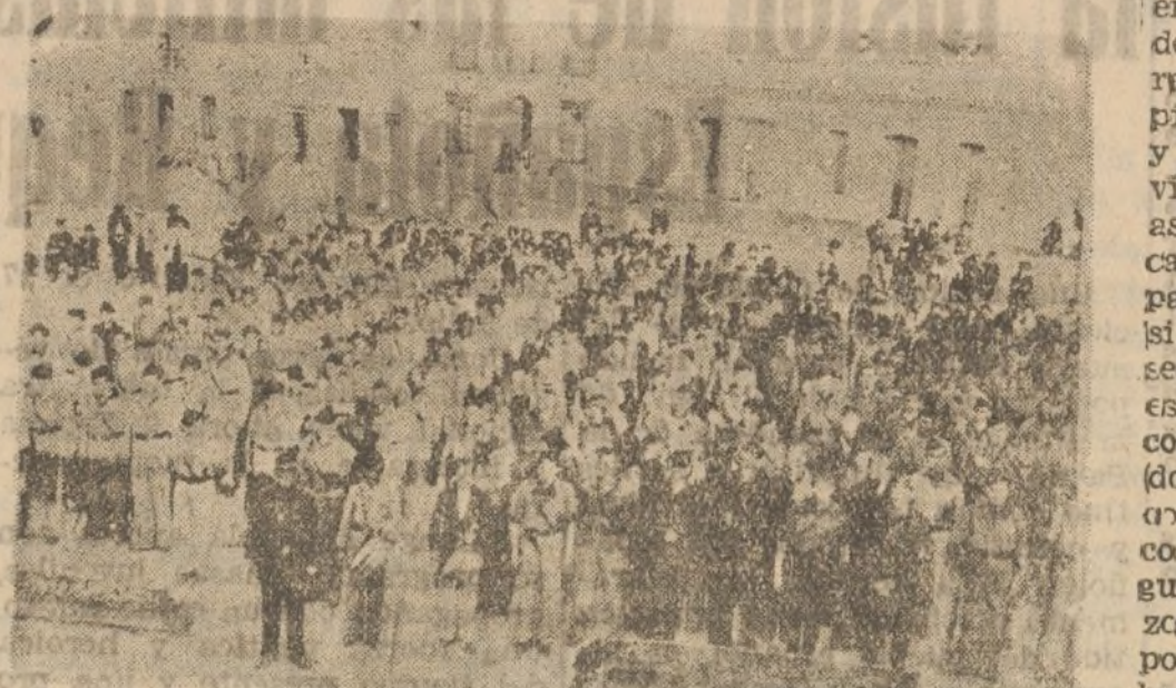
La 4.ª Bandera de F. E., que anoche salió para el frente.

Anoche, tuvo lugar la despedida de la cuarta Bandera de Falange, que salió para el frente. Parte de dichas fuerzas se encontraban prestando servicios en distintos pueblos de la provincia, uniéndose la mayoría al tren en la estación de San Juan del Puerto. Las fuerzas que se encontraban en Huíva desfilaban por varias calles.