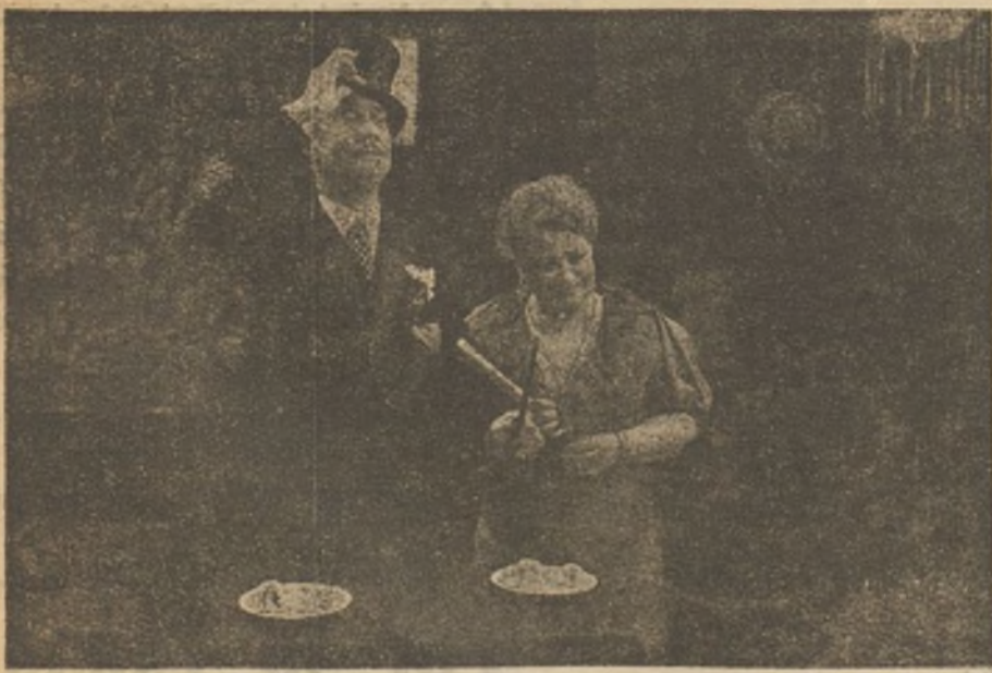
La Señorita de Trevelez