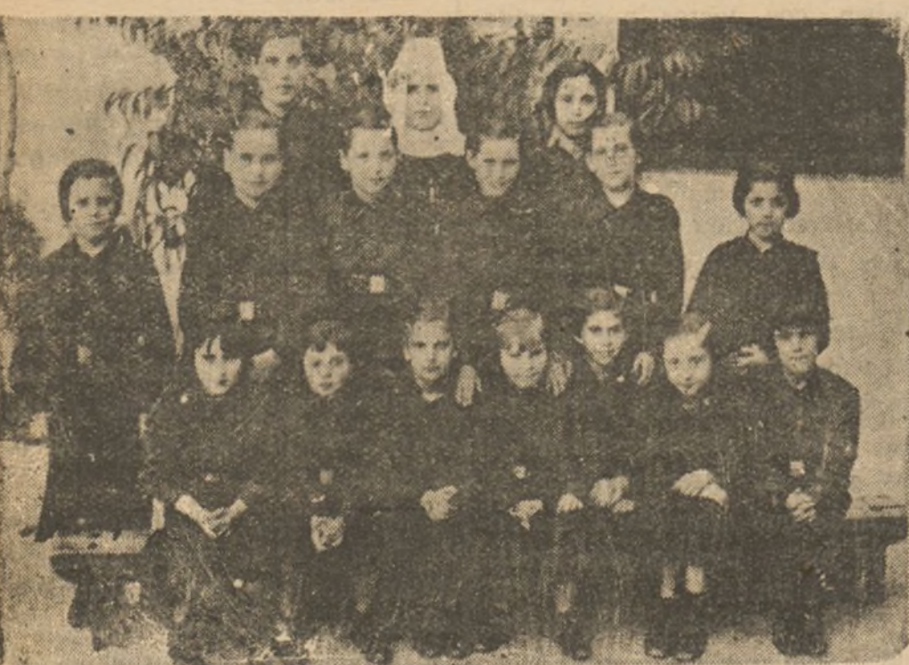
LAS INTERNAS DEL COLEGIO DEL SANTO ANGEL, CON LA SUPERIORA

(Continúa este reportaje en la página siguiente)