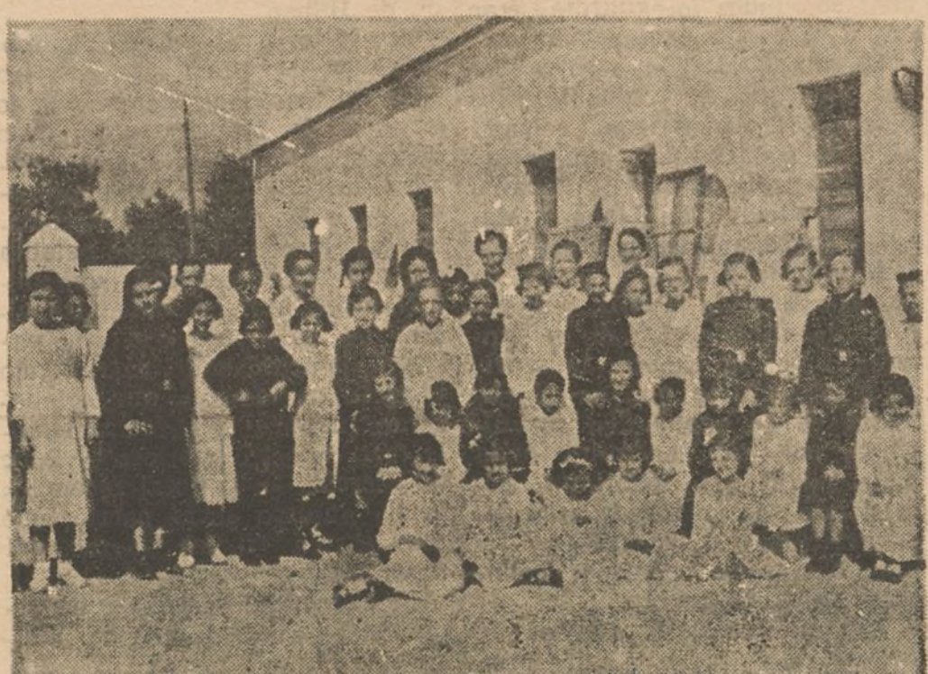
EN EL BLANQUILAZO DE ESTA "FOTO" PUEDE APRECIARSE LA SUBLIME CONVIVENCIA DE LAS PENSIONISTAS DE LA "CASA DEL FLECHA" CON SUS COMPAÑERAS DE INTERNADO, EN EL COLEGIO DE LAS TERESIANAS

—Estas niñas, como aquellas, reciben igual trato sin distin-