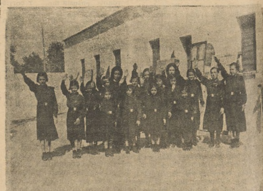
PROFESORAS TERESIANAS Y SUS ALUMNAS, LAS AHILJADAS DE FALANGE

No creo necesario prolongar el diálogo y pasamos al patio, donde están las demás niñas, que