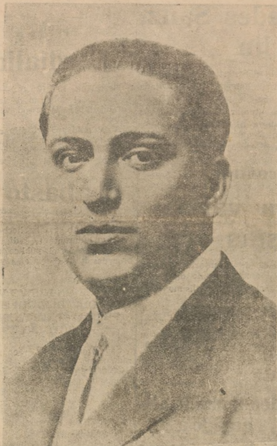
JOSE CALVO SOTELO, INSIGNE PATRICIO VICTIMA DEL MAS ALEVOSO DE LOS CRIMENES, MARTIR DE LA ESPAÑA IMPERIAL

Este día de oración en el aniversario de Calvo Sotelo, lo es también de himno: ¡Viva Franco! ¡Arriba España! ¡Viva España!