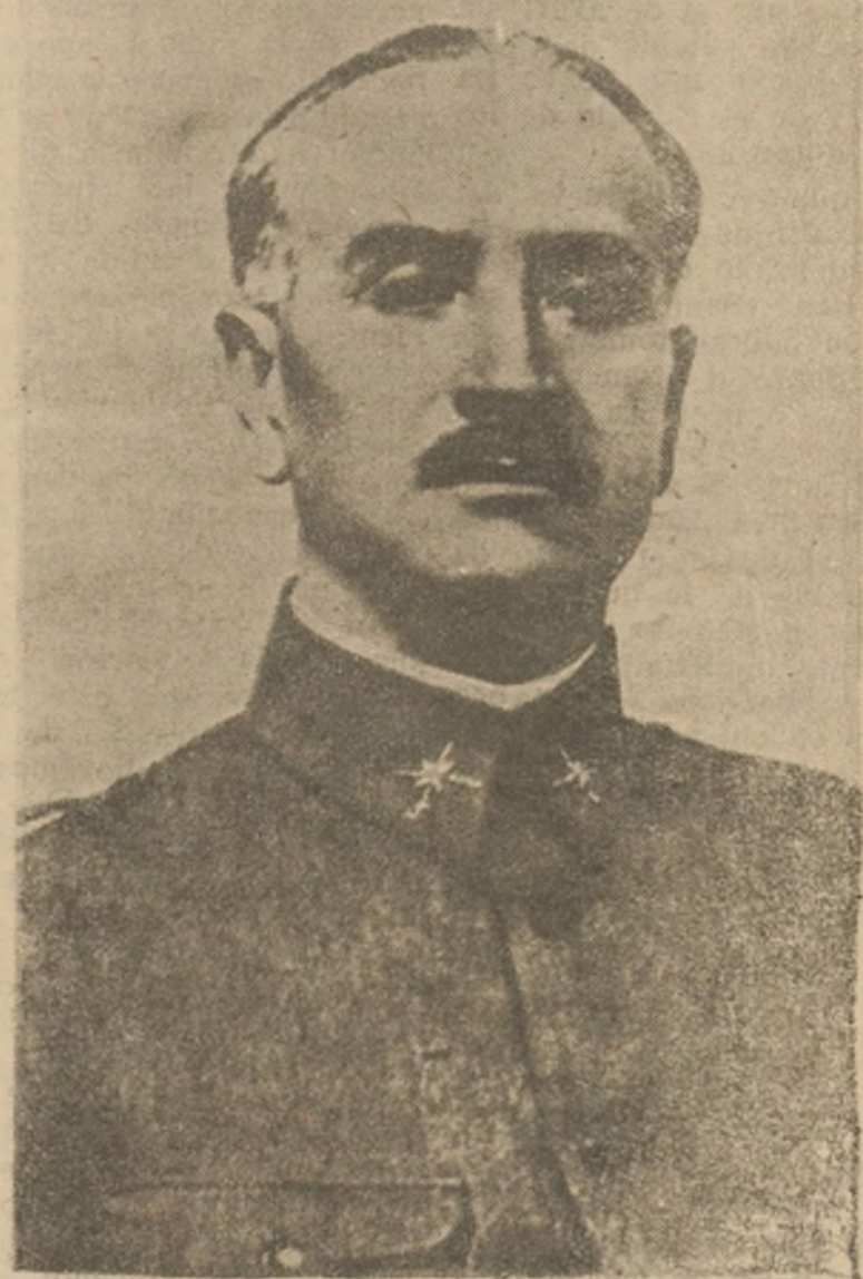
GENERAL DE LOS EJERCITOS DEL SUR, CONQUISTADOR DE ANDALUCIA, CUYAS FAMOSAS CHARLAS, ARIETES EN EL CORAZON MARXISTA, ES LA MAS CLARA EXPONENTE DE SU RE CIA CONSTITUCION DE MILITAR ESPANOL.

La voz de los muertos es la única que se debe oír para que ella informe todos los actos de la Nueva España