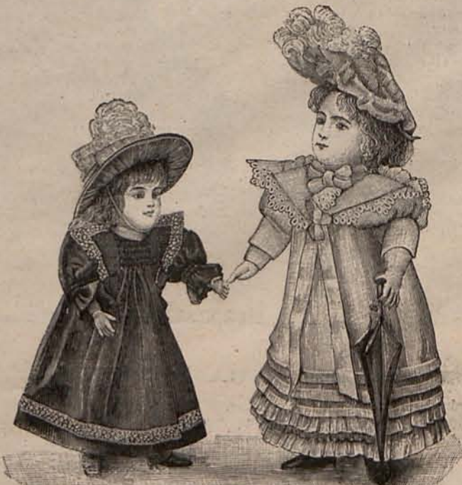
Núm. 7 y 8.—Trajes para paseo.

Si el año ha sido malo para la nación en general, le reputarán como el más feliz de su existencia aquellos que durante él han realizado sus más ardientes deseos, los que se han casado con la persona amada, los que han visto nacer al hijo anhelado, los que han concluido su