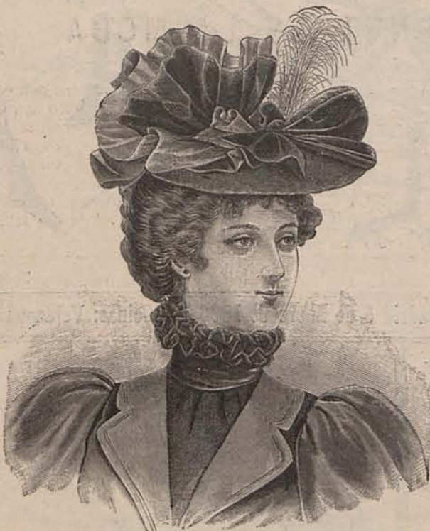
Núm. 2.—Sombbrero Lucila.

«Predomina en un país el elemento militar?» Pues los niños juegan á los soldados, y las niñas hallan un placer convirtiéndose en cantineras ó en hermanas de la Caridad. El elemento religioso es en una ciudad superior á los demás? Los niños jugarán á decir misa, formarán