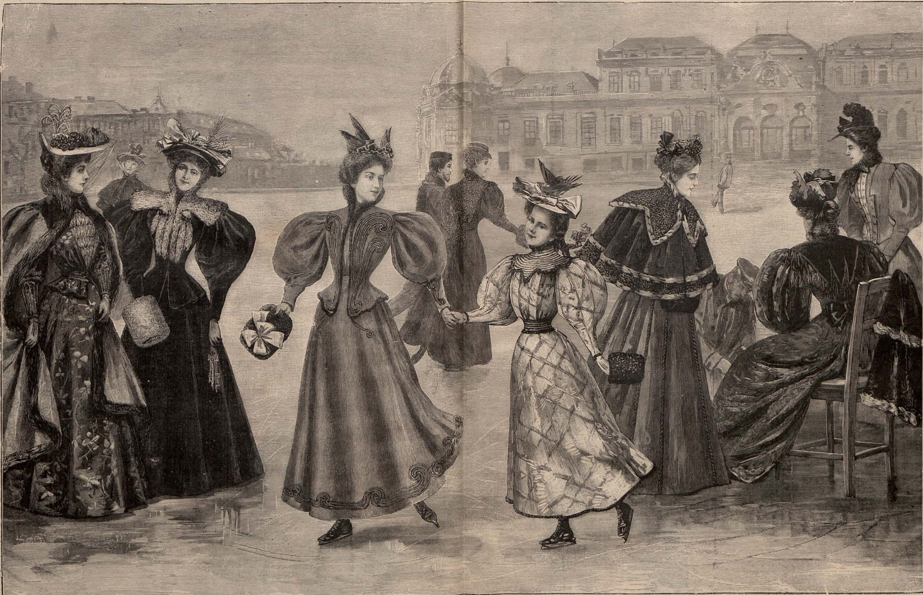
Núm. 4.—PANORAMA DE TRAJES PARA PASEO Y TRAJES PARA PATINAR.

Es verdad que por todas partes se vá á Roma, ó lo que es