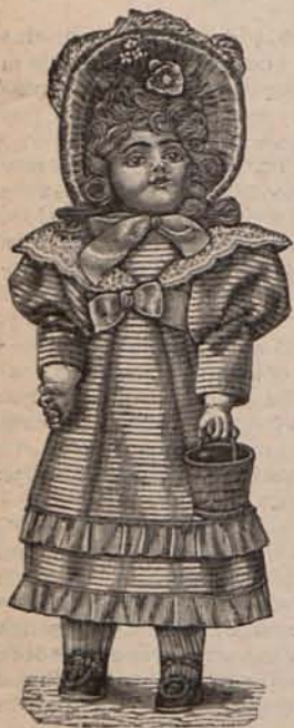
Núm. 1.—Traje para paseo.

un botón ó un clavito, lo que no deja de ser peligroso, se corre el riesgo de que los mencionados objetos sean vehículos de enfermedades infecciosas.