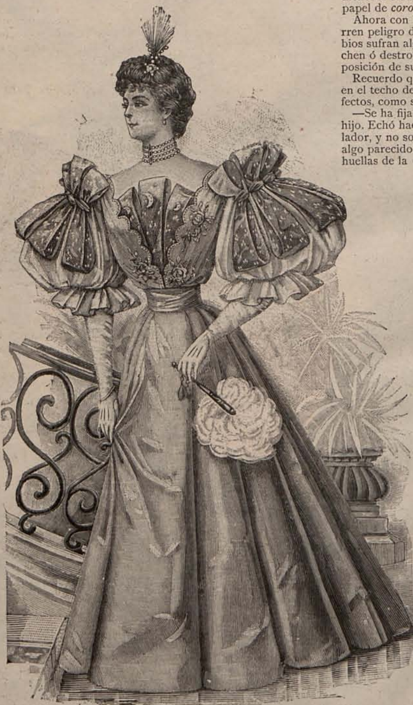
Núm. 3.—Traje para soirée.