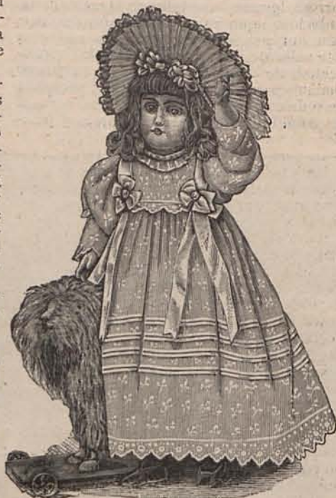
Núm. 6.—Traje para paseo.

Las damas parisienses han vacilado algo antes de volver á los tiempos de las antiguas monarquías; pero al fin han cedido, y en los salones aristocráticos ha comenzado á practicarse discretamente la costumbre de hacer que se besa la mano de la señora á quien se saluda.