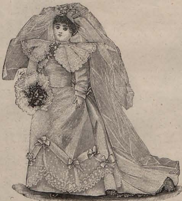
Núm. 5.—Traje de novia.

Al notarlo, hizo con la mayor naturalidad del mundo y al mismo tiempo con adorable gracia, un ligero movimiento para separar el brazo del cuerpo, que la obligó á dar la mano del modo ya indicado; y agradó tanto á las señoras presentes, que desde aquel instantes resolvieron