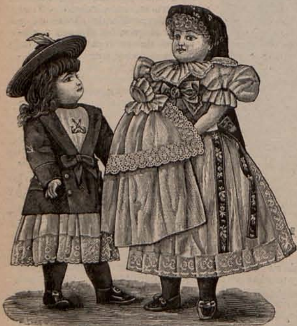
Núms. 3 y 4.—Trajes para paseo.

ESTAMOS en el período del visiteo, los amigos gozosos de verse sanos y salvos en el Nuevo Año, se estrechan con efusión las manos. La Moda, que de todo se ocupa, establece y varía con frecuencia lo mismo que los trajes y los adornos la expresión de los sentimientos, ó para hablar más claro, las fórmulas de lo que llamamos urbanidad.