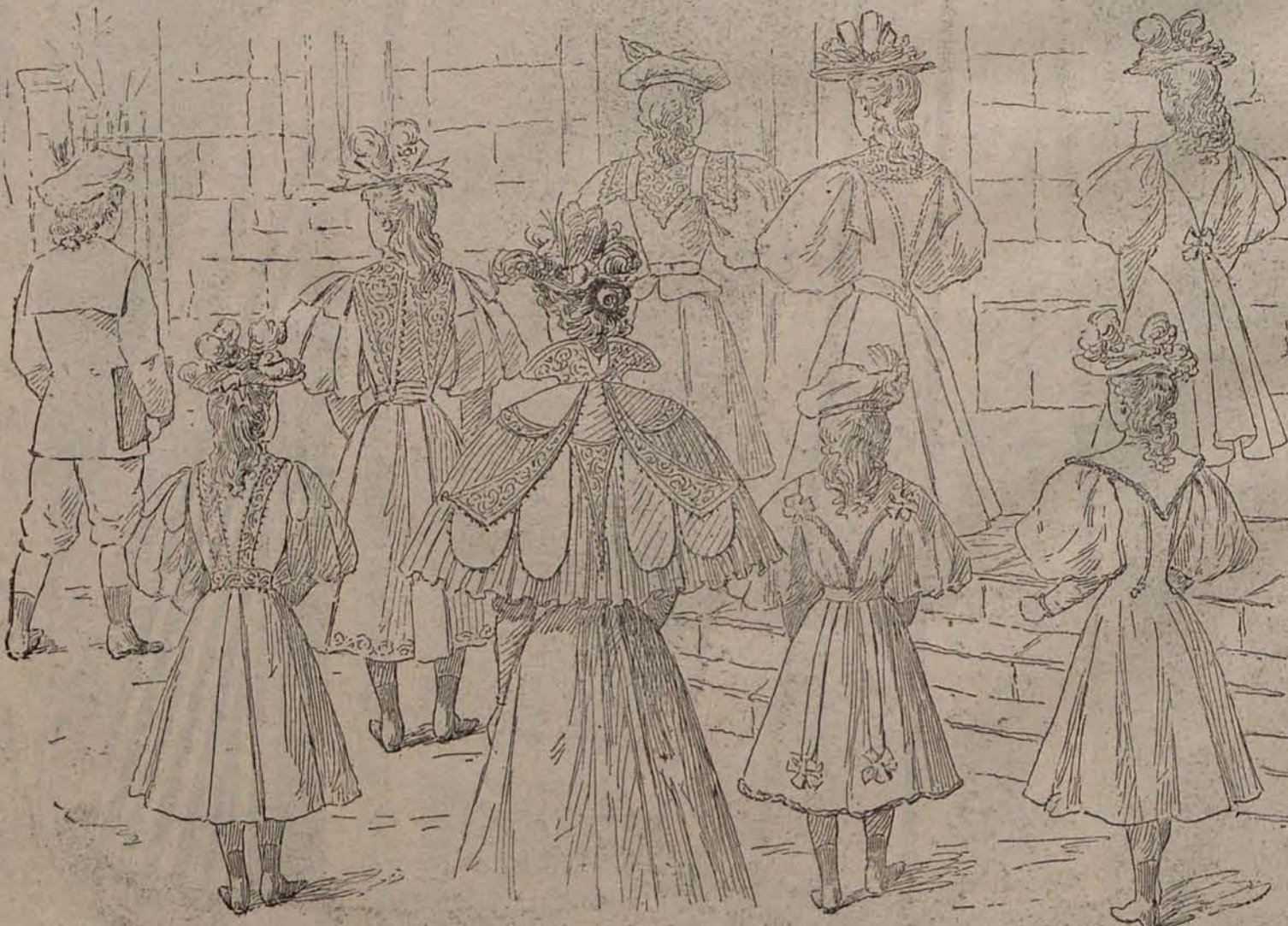
Núm. 10.—Reverso del grabado núm. 1.

lequito de raso ciopelo. Sombrero eléctrico, adorno de cinta de raso centro se escapa plumas azules. traje: 2 pesetas. de 7 á 8 años.—lisa y cuerpo-puntiagudo ca-