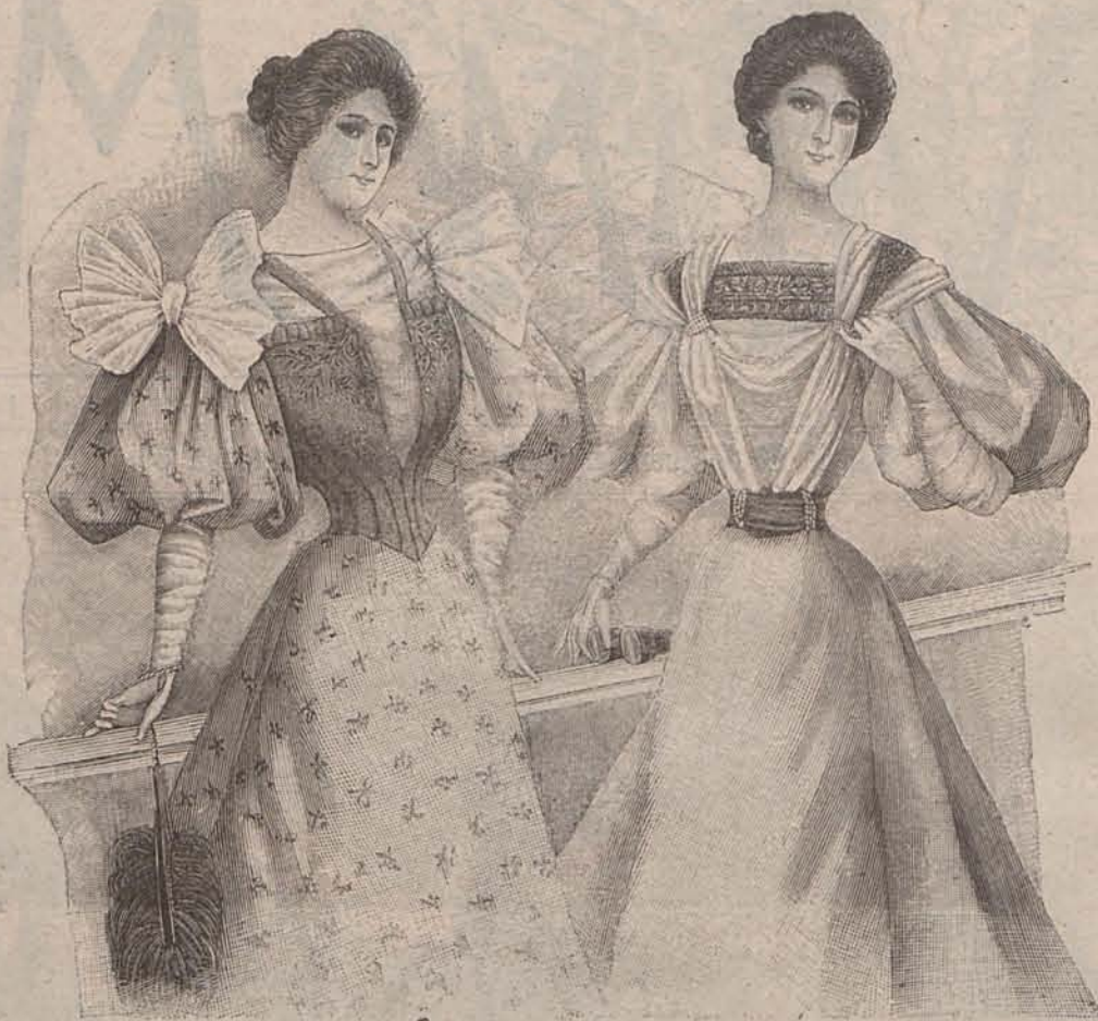
Núm. 2.—Trajes de teatro para señoritas

¿Qué de sorpresas nos ofrece la vida moderna! Cuando menos se espera, la familia modesta que apenas podía atender á sus necesidades más penitentes con el producto del trabajo del jefe de ella, ó con el sueldo que ganaba en un humilde empleo, aparece en los teatros desplegando gran lujo, en el Bois de Boulogne , en magníficos carruajes tirados por tronos, cuyo valor no baja de quince ó veinte mil francos, habita en suntuoso hotel, dá grandes fiestas y gasta sumas fabulosas. ¿Cómo se ha hecho el milagro? Unos se asombran, otros murmuran, todos rinden tributo á los que se han enriquecido sea como sea, le envidian, desearían su suerte ó una ocasión para dominar á esta ca-