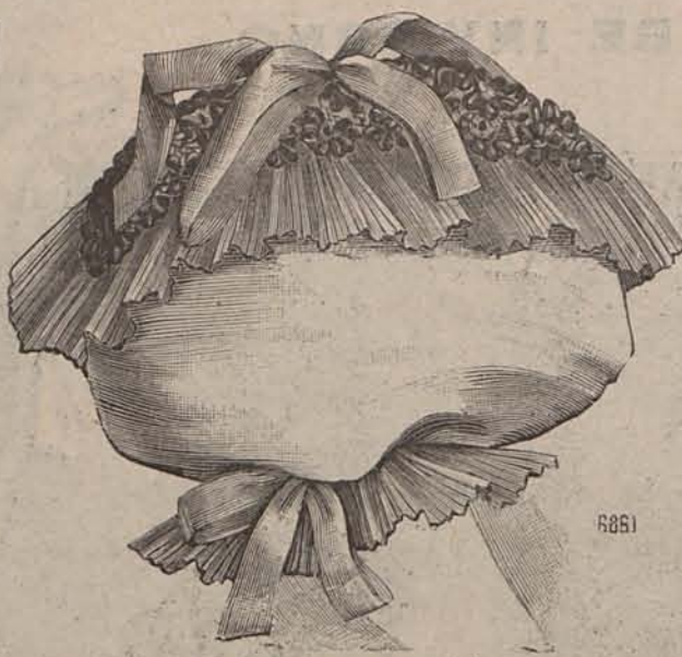
Núm. 7.—Manga para traje de baile.

Modelo 4.—Para niño de 5 á 7 años.—De terciopelo marrón. Pantalón bombacho, ajustado bajo la rodilla por medio de elásticos interiores. Chaquetita recta, que adorna un cuello marinero con puntas redondeadas de piel de seda