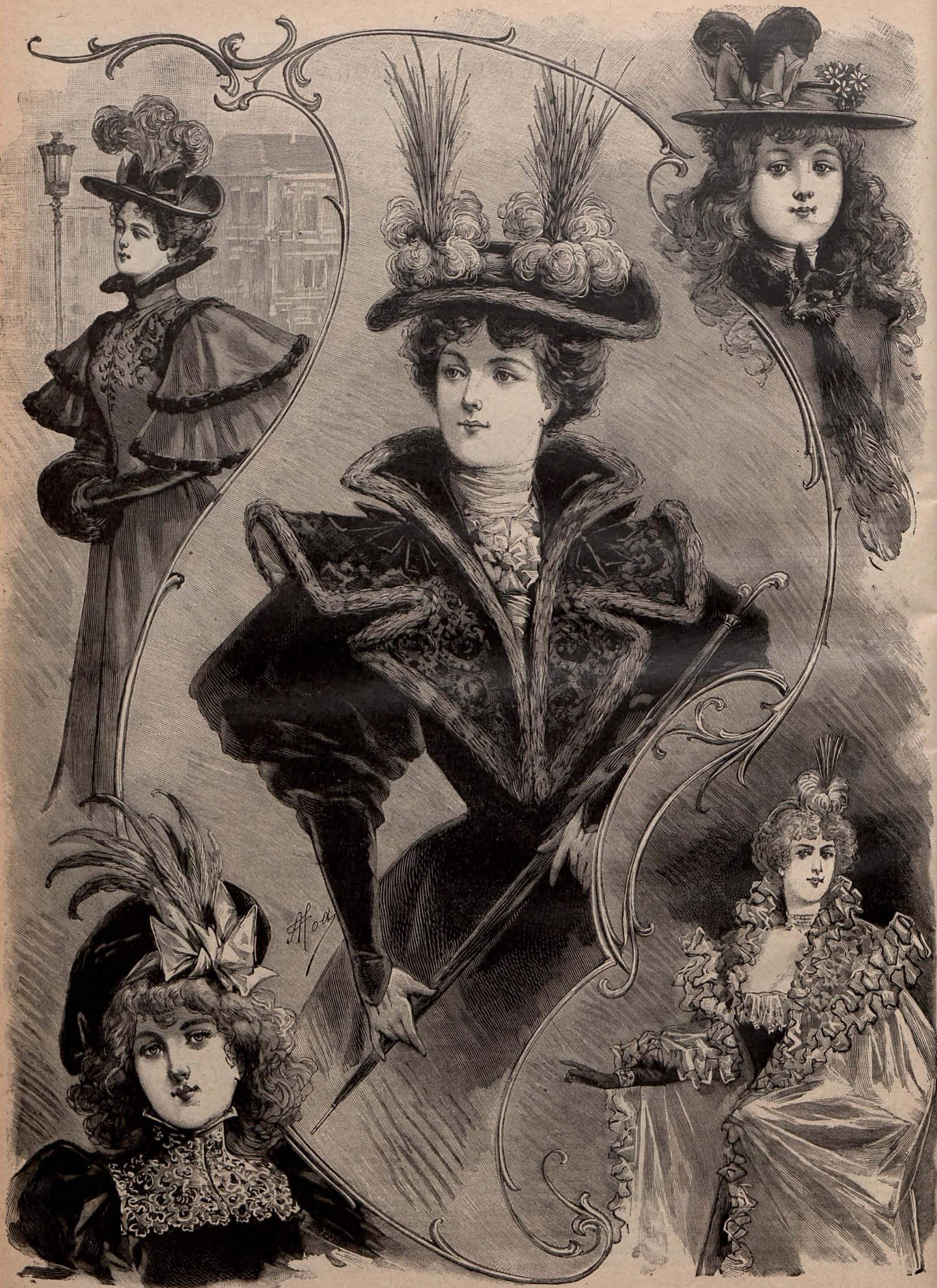
Núm. 4.—GRUPO DE MODAS DE INVIERNO Ayuntamiento de Madrid