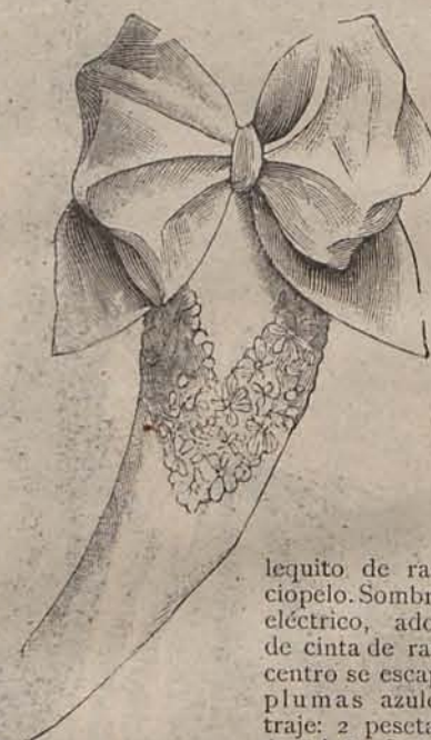
Núm. 9.—Manga para traje de baile.

Modelo 9.—Para niña de 13 á 14 años.—De pekin de lana color grosella. Falda acanalada con delantero sobrepuesto. Cuerpo corto, entallado por medio de un cinturón ruso de pasamanería negra. La parte superior, tanto de la espalda como de los delanteros, está escotada acentuadamente sobre un plastrón haciendo juego con el cinturón, rodeado de caprichosas solapas de terciopelo negro, perladas en los contornos. Mangas de pernil. Sombrero de terciopelo negro, adornado con plumas negras y un lazo mariposa de cinta de raso color grosella. Precio del patrón del traje: 2 pesetas.