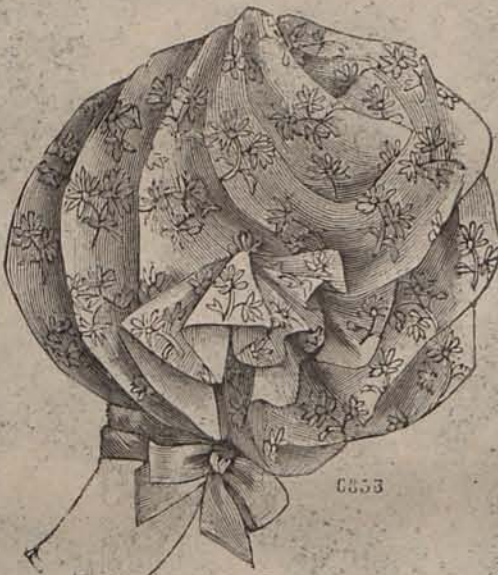
Núm. 8.—Manga para traje de comida de ceremonia.

mente adornada en el bajo del delantero con un motivo bordado con soutache de seda blanca. La chaqueta, de terciopelo, se prolonga en la espalda en dos largas aldeltas que se confunden con los pliegues acanalados de la parte de detrás de la falda. Los delanteros lucen en los contornos un ligero bordado perlado, y se cruzan acentuadamente dejando apenas al descubierto un cha-blanco. Mangas de terciopelo azul adornado con un doble lazo color masilla; de cuyo un bonito grupo de Precio del patrón del