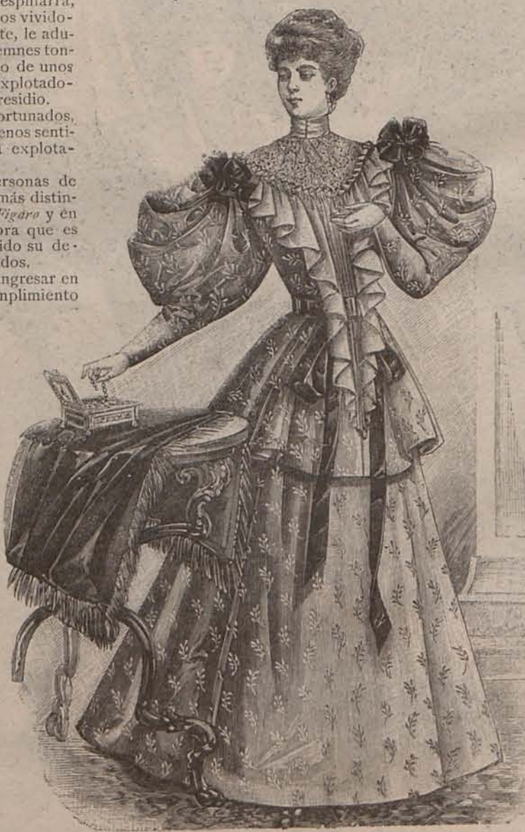
Núm. 3.—Deshabillé elegante.